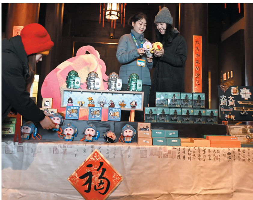
乾楼文化展览馆工作人员正在布置文创产品。

本报讯 (记者 王春艳) 2月7日，乾楼文化展览馆文创媒体见面会在大同古城墙西北角乾楼举行，活动集中发布城墙与乾楼相关文创产品20余种，另有古建筑及城市相关文创80余种、马年限定文创20余种。 本次活动不仅是文创成果的集中亮相，也是大同古城文化传承与创新的重要实践，旨在通过文创产品、场景营造与空间设计的多维呈现，活化大同古城文化IP，融合非遗戏曲与传统建筑美学，让本土文化资源实现创造性转化、创新性发展，深化地域文化与创意设计跨界融合，进而为我市文旅产业发展注入新活力。 走进展览馆，古都底蕴与创意巧思扑面而来。一方方空间融传统建筑美学于细节肌理，非遗戏曲的雅致韵味萦绕其间，登楼品茗的温润意趣于桌席杯盏，广灵剪纸与大同铜器等非遗展示更是尽显匠心神韵。此次活动中，多款文创产品的亮相吸引着众人目光，这些文创产品均由本土设计师采用大同特色元素设计，涵盖生活家居、毛绒挂件、办公文具等品类。其中，乾楼系列文创冰箱贴集美观与实用于一体，以大同古城文化IP，融合非遗戏曲与传统建筑美学，让本土文化资源实现创造性转化、创新性发展，深化地域文化与创意设计跨界融合，进而为我市文旅产业发展注入新活力。 走进展览馆，古都底蕴与创意巧思扑面而来。一方方空间融传统建筑美学于细节肌理，非遗戏曲的雅致韵味萦绕其间，登楼品茗的温润意趣于桌席杯盏，广灵剪纸与大同铜器等非遗展示更是尽显匠心神韵。此次活动中，多款文创产品的亮相吸引着众人目光，这些文创产品均由本土设计师采用大同特色元素设计，涵盖生活家居、毛绒挂件、办公文具等品类。其中，乾楼系列文创冰箱贴集美观与实用于一体，以大同古城文化IP，融合非遗戏曲与传统建筑美学，让本土文化资源实现创造性转化、创新性发展，深化地域文化与创意设计跨界融合，进而为我市文旅产业发展注入新活力。