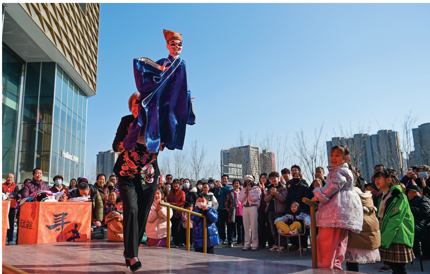
2月7日，游客在活动现场观看木偶戏表演。 2月7日，2026年西安市“我们的节日·春节”主题示范活动在西安市未央区举行。此次活动融合非遗体验、民俗展演、年货市集、互动游戏等多种形式，为即将到来的新春佳节营造出浓浓的节日氛围。

数字金融提升服务效率。该行持续推进数字化转型，运用大数据与智能模型优化客户识别、信用评估与服务流程，提升金融服务的覆盖面和便利度。截至去年末，该行金融贷款余额达6000万元，未来将进一步推动服务向智能化、场景化延伸。 下一步，邮储银行大同市分行将紧扣新质生产力发展要求，进一步做深做实“五大文章”，以产品迭代、服务优化、数字智能升级为重点，健全风控体系，为我市实体经济与民生发展提供更精准、更温暖、更高效的金融服务。 (李冬梅 郑燕 梁奕君)