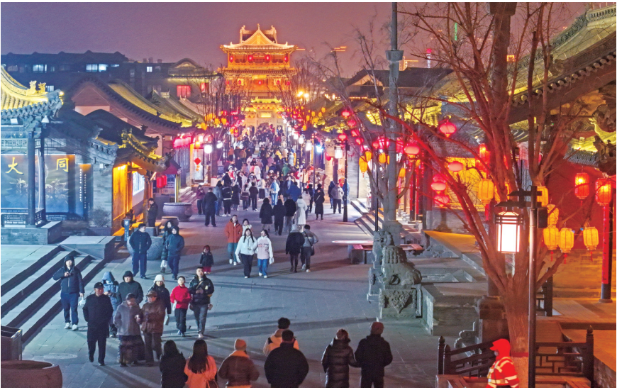
大同古城灯火璀璨分外漂亮。