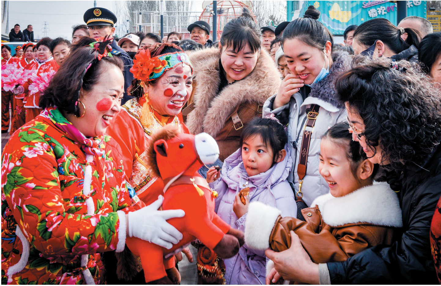
3月1日，2026年“大同年”云冈味“社火民俗展演活动在云冈区开启，该区各乡镇巡游队伍为全区群众献上精彩的社火民俗表演。图为社火民俗演员与围观群众互动。