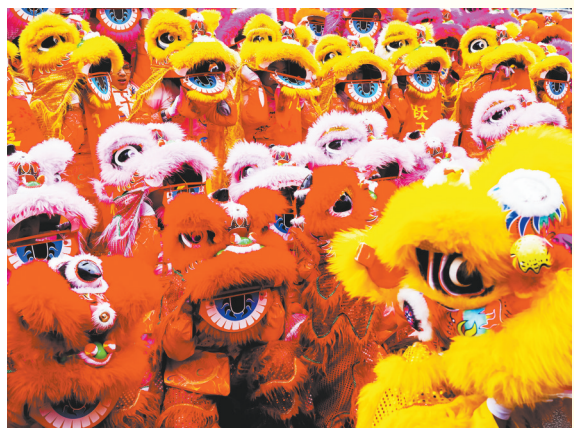
灵丘：群狮闹春乐开怀。