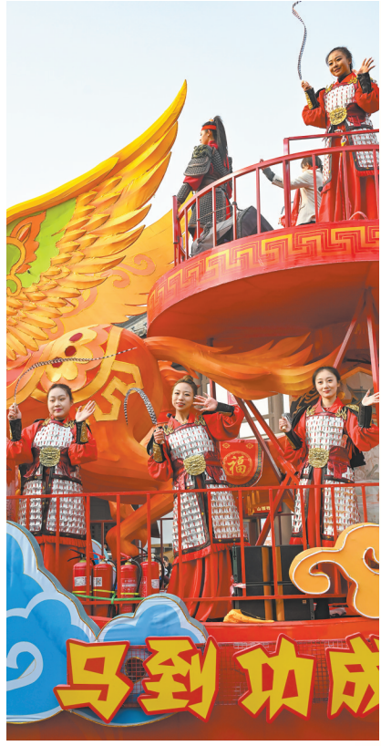
平城古韵花车行，巾帼英姿别样红。