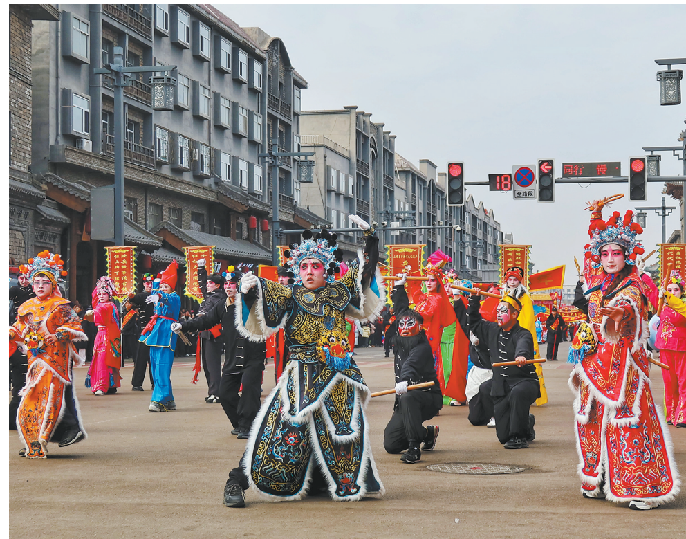
浑源：踏歌街头趣演故事。