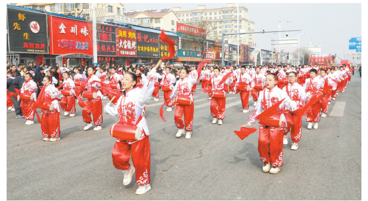
天镇：鼓韵飞扬喜迎新春。