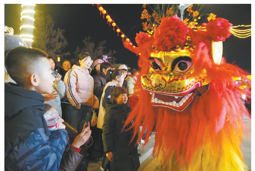
阳高：祥瑞运巷陌欢腾。

欢声笑语中，人们感受着传统民俗的魅力，品味着团圆和睦的幸福。这场全民参与的元宵盛宴，传承了非遗文化，凝聚着奋进精神，彰显出全市经济发展、社会和谐、人民幸福的良好风貌，为新年的发展奏响了激昂的序曲。 本报记者 史涌涛