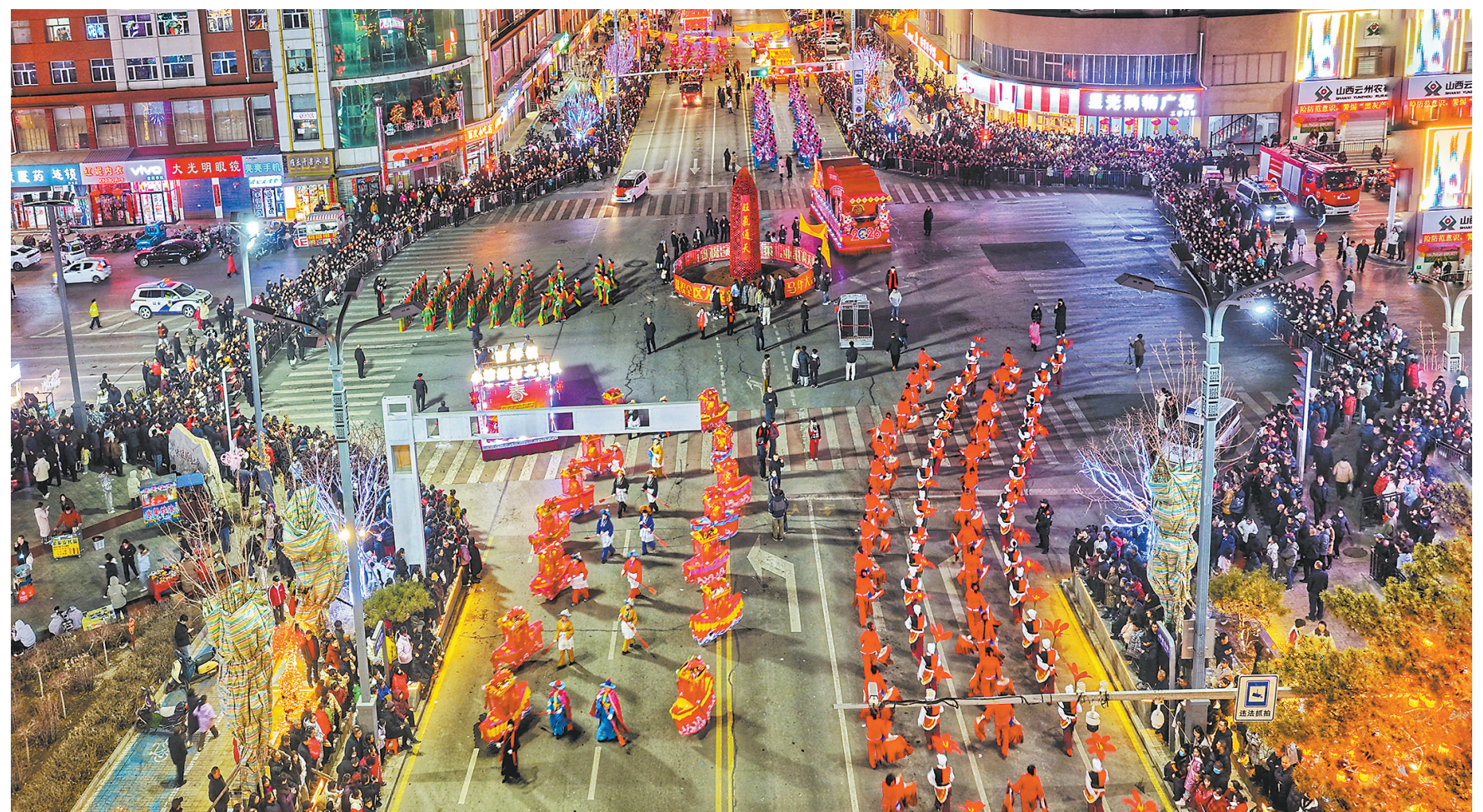
云州：灯影流光秧歌踏夜。