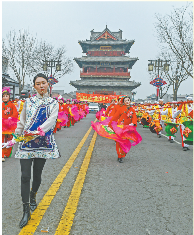
古都新春映笑颜，秧歌起舞醉平城。