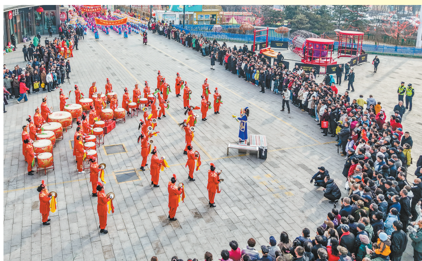
云冈：锣鼓喧天闹元宵。

春风拂过古长城，锣鼓声震云冈窟。在丙午年元宵佳节来临之际，全市各县区张灯结彩、喜气洋洋，从大同古城到各县区街头，一场场精彩纷呈的社火巡游和非遗展演竞相登场，把云中大地的节日氛围推向高潮，共同绘就了喜庆祥和的元宵欢腾图景和欢歌奋进的春日画卷。 作为活动的核心舞台，大同古城内人潮涌动，“喜乐元宵游平城”社火巡游吸引万众同乐，威风锣鼓鼓点如雨，奏响盛世欢歌，雄狮腾跃，尽显勃勃生机。在浩浩荡荡的队伍中，既有充满大同年俗特色的精彩表演，还有身着古装的机器人与机器马向市民游客挥手送福，实现了传统与现代的激情碰撞。 这股喜庆的热潮同样涌动在各个县区。云冈区打造传统民俗展演平台，舞龙、跑驴、旱船等经典项目轮番上演；云州区街头立起高大的旺火，“骏马奔腾闹元宵”社火活动热闹非凡，“火山璀璨之夜”烟花秀更将节日氛围推向高潮；新荣区新春彩装巡游让年味浸透街头巷尾。灵丘县文艺巡游融合传统社火与怀旧游戏，展现出乡村振兴的崭新风貌。阳高县的舞龙舞狮、扭秧歌、划旱船、踩高跷等年俗表演赢得阵阵喝彩。左云县街头，踩高跷的艺人步伐稳健，扮相各异的戏曲人物沿街展演，竹马、旱船穿梭其中。广灵县的民俗表演及彩车巡游，展现出欢乐中国年、地道广灵味。天镇县的威风锣鼓气势磅礴，鼓声铿锵有力、响彻云霄。浑源县的耍龙舞狮热闹非凡，并有盛大欢腾的无人机表演与烟花秀表演，璀璨烟火点亮夜空，映照人们欢欣的笑脸。 欢声笑语中，人们感受着传统民俗的魅力，品味着团圆和睦的幸福。这场全民参与的元宵盛宴，传承了非遗文化，凝聚着奋进精神，彰显出全市经济发展、社会和谐、人民幸福的良好风貌，为新年的发展奏响了激昂的序曲。 本报记者 史涌涛