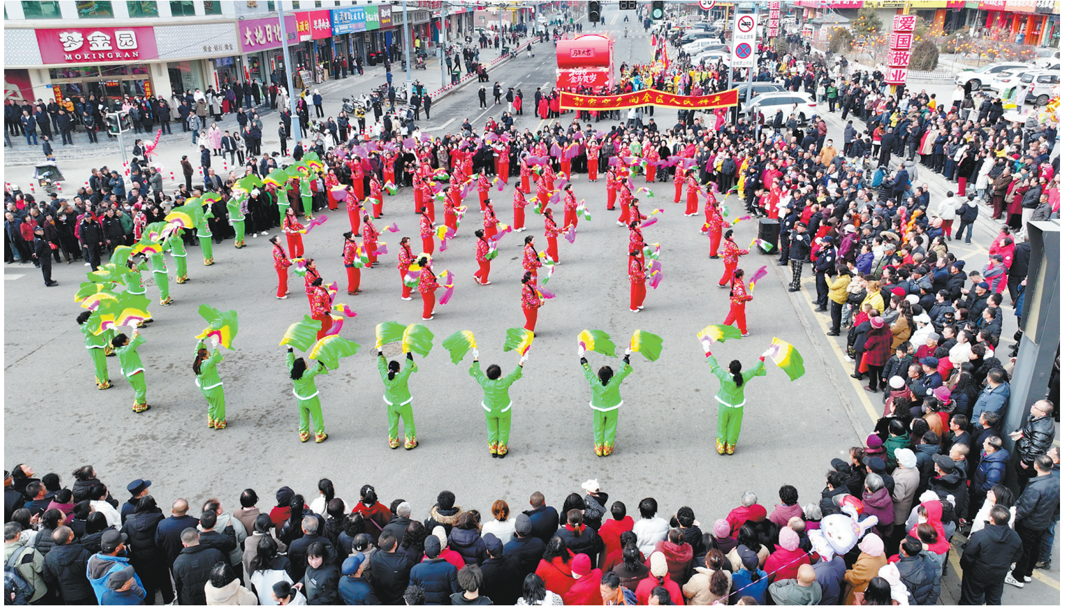
新荣：秧歌欢舞万众同乐。