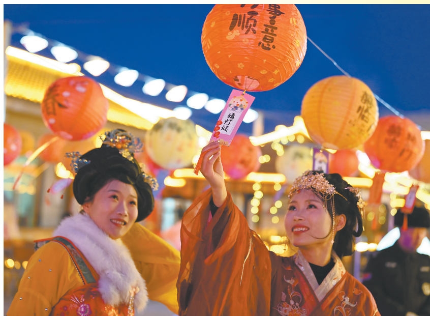
广灵：乐猜灯谜品民俗。