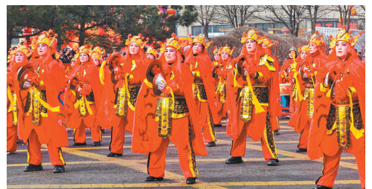
左云：锣鼓铿锵声震街头。