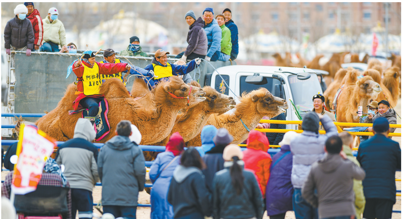
3月8日，赛驼手在8000米成年骆驼地赛场比赛中。3月8日，阿拉善骆驼超级联赛总决赛在阿拉善左旗巴彥浩特赛驼场火热进行。来自内蒙古巴彦淖尔市、锡林郭勒盟及阿拉善盟本地的60余名选手携爱驼参加了骆驼地赛场、骆驼越野赛、骆驼接力赛、赛驼射箭等特色竞技比赛项目的角逐。

公安部门同步介入，快速侦破火案，形成有效震慑。 强基固本，夯实物资保障。近五年来，该县财政累计投入护林防火费用5816余万元，为乡镇配备集装箱房100个、防火水车12辆，合理布局物资储备库点。队伍建设同步加强，专业扑火队、应急救援队、消防救援队等共计88人，412名专职护林员遍布一线，形成梯队化扑救格局。建成林火阻隔系统114.57公里、防火道路99.75公里、蓄水池10个，积极探索无人机巡护、AI智能监控等科技应用，让防火工作更具现代化水平。 该县相关负责人表示，将继续补短板、强弱项，持续完善防火监测体系，加强专业队伍标准化建设，以更高标准、更严要求抓实森林草原防火工作，让绿色成为左云县高质量发展最鲜明的底色。