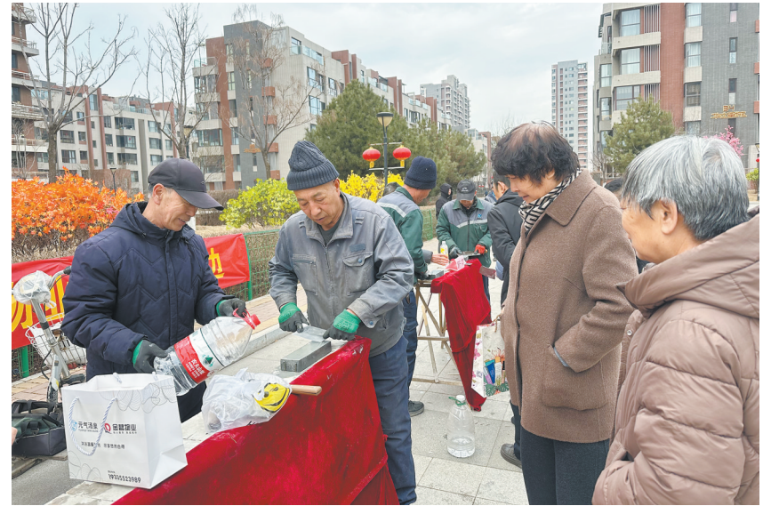
图为志愿者为华北星社区居民磨剪刀和菜刀。