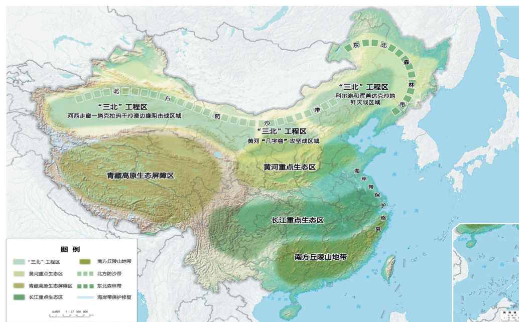
图3 重要生态系统保护和修复重大工程布局图