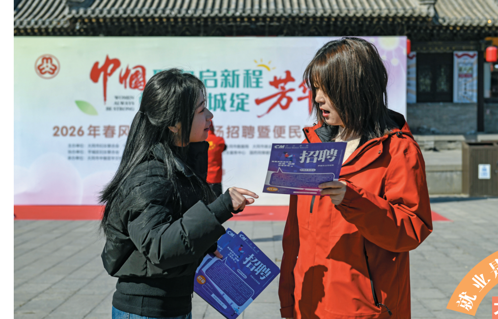
图为招聘活动现场,求职者在企业招聘展位前咨询。

本报讯(记者 董芳)3月15日,以“巾帼聚力启新程 情满古城绽芳华”为主题的2026年春风行动妇女专场招聘暨便民服务活动在大同古城纯阳宫广场举行,为广大女性求职者搭建精准对接、务实高效的就业平台。 本次招聘会多家企业积极参与,提供岗位包括数据标注员、母婴护理、养老护理等,为不同年龄段、不同专业背景女性求职者提供更多就业选择。现场设立健康咨询关爱、就业创业指导、维权法律服务、未成年人