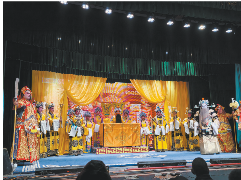
图为经典晋剧剧目演出现场，村民过足了戏瘾。

该村负责人表示，此次戏曲演出活动将文化惠民、民俗传承与春耕动员、乡村振兴融为一体，不仅提振了村民春耕生产的精气神，更通过文化活动聚集了人气，激活了乡村“微消费”，为村民拓宽了增收渠道，展现了文化赋能乡村振兴的生动实践。