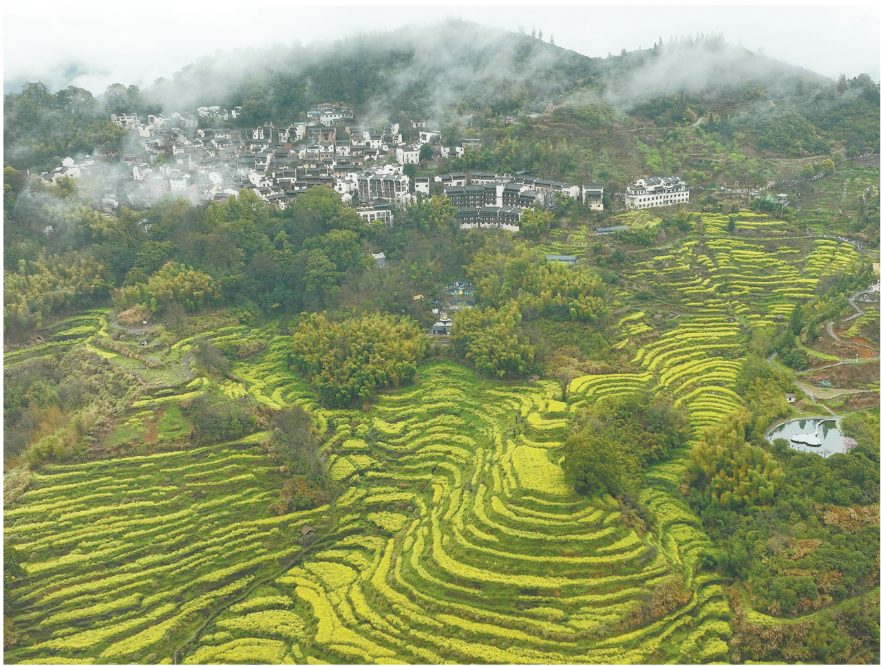
这是3月24日拍摄的江西省婺源景区篁岭景区的油菜花梯田（无人机照片）。近日，江西省婺源县13万亩油菜花竞相绽放，吸引了众多游客前来踏青赏花。记者以微距镜头定格格花之细微，金黄花瓣舒展，露珠晶莹点缀，展示别样春花之美。新华社记者 万象摄

本次活动是我市学校深入落实“健康第一”教育理念的生动实践，既为学生搭建倾诉心声、释放情绪的平台，也让大家掌握应对困难、调节心态的实用方法，为学生健康成长注入“心”能量。