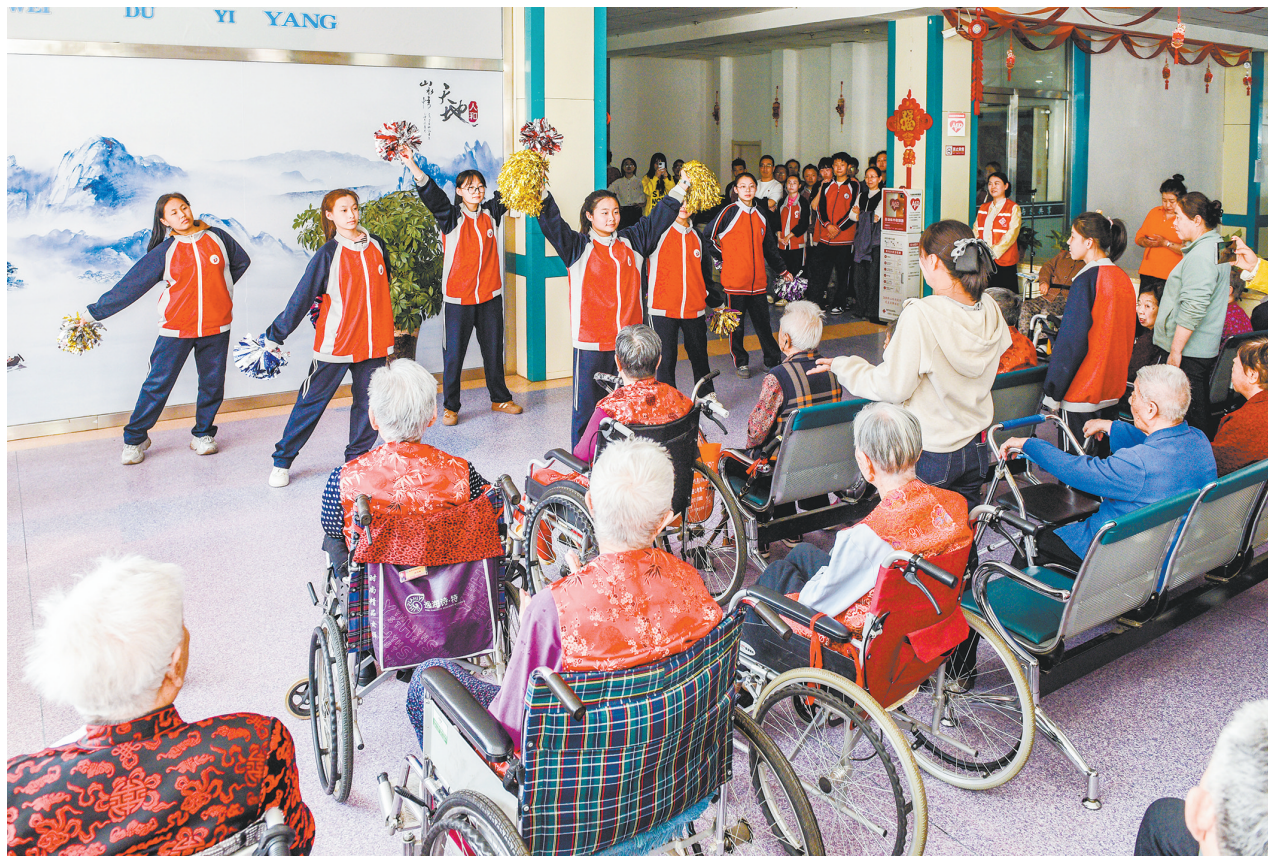
近日,市特殊教育学校教师带领学生走进市魏都身心康复护理院,开展“学雷锋做志愿 情暖夕阳共奋进”志愿服务活动。师生分工协作,打扫卫生、整理房间、表演节目,在传承雷锋精神的同时,也温暖了老人,让特教师生在实践中增强了责任感与奉献精神。