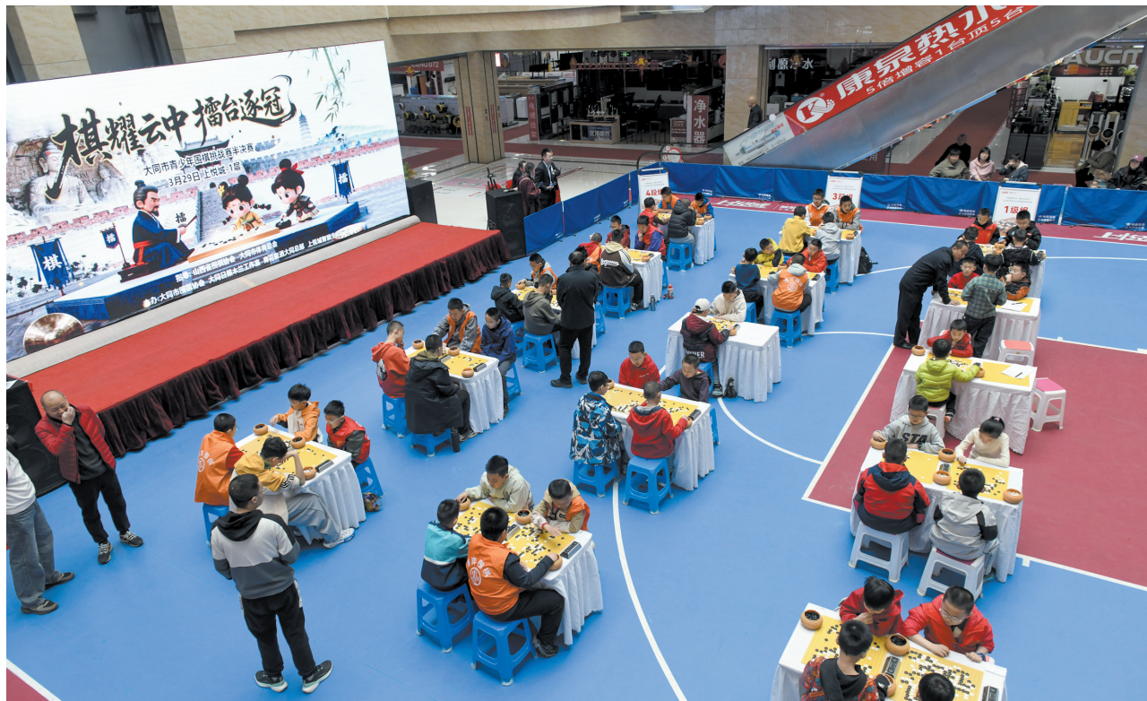
图为全市青少年围棋挑战赛半决赛现场。