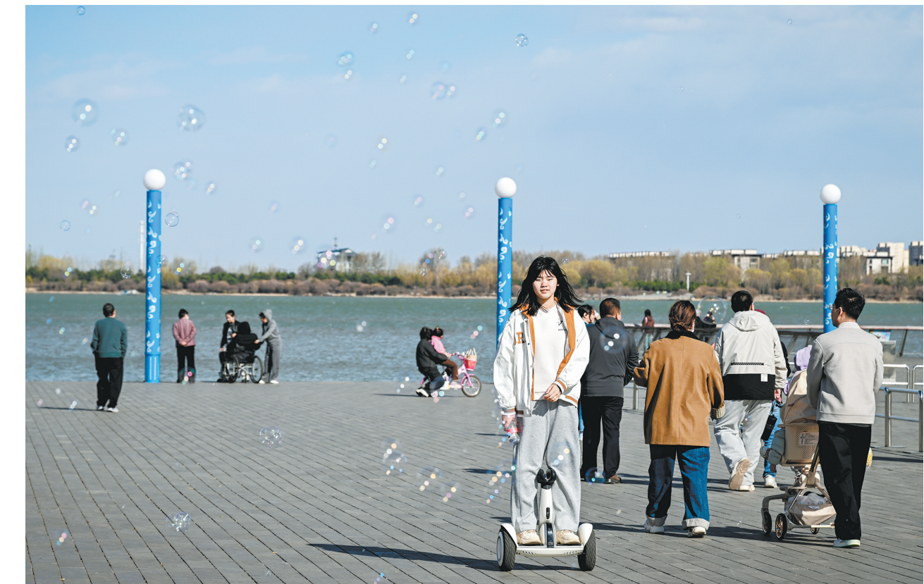
清明节假期，我市各景区景点游客激增，众多市民主动将古城等热门景点“让”给远道而来的客人，转而选择近郊踏青赏春等户外休闲活动。图为市民在文瀛湖畔乐享惬意假日时光。