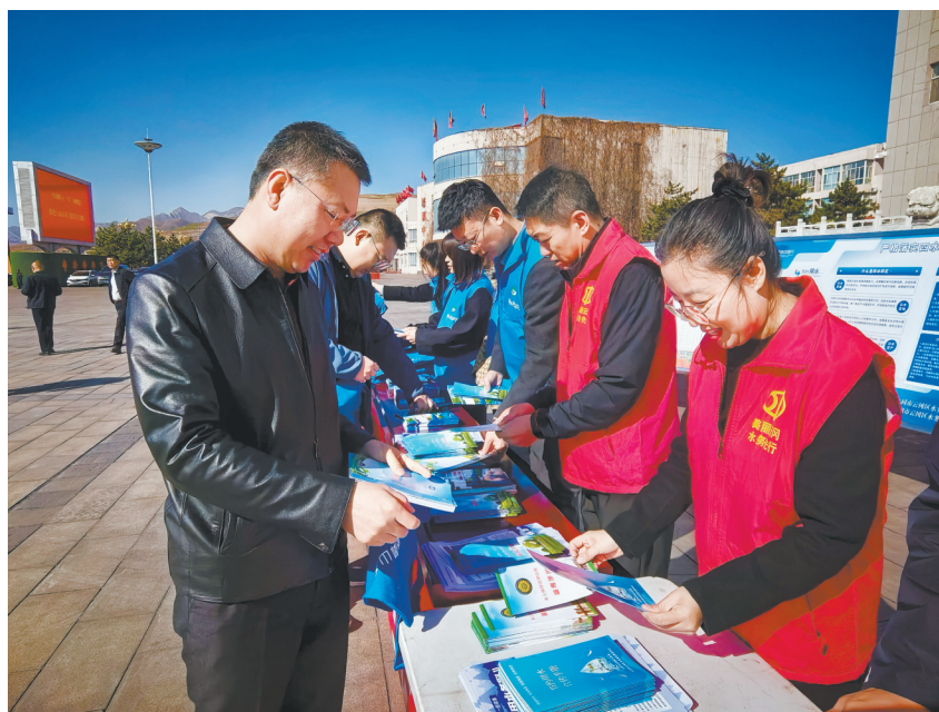
活动中，工作人员向群众普及节水知识。

据悉，此次“五进”宣传活动覆盖面广、针对性强，累计发放各类宣传资料3000余份、宣传品2000余份。