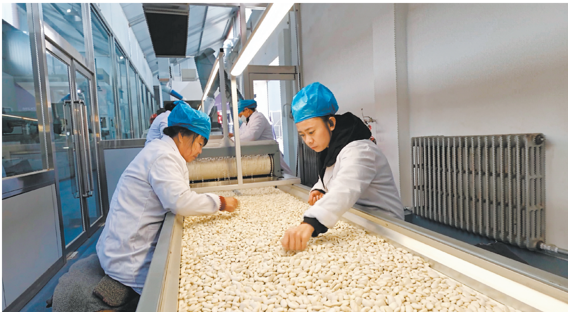
图为天镇县通航粮贸公司的小杂粮生产线上，工人们正在对白芸豆进行严格筛选，确保品质良好。

春回塞上，农事渐起。行走在云中大地，随处可见农民忙碌的身影，一台台农机具在沃野上往来穿梭，播种、施肥、灌溉带一次性完成……这幅生机勃勃的春耕图景，正是我市坚持深耕有机旱作农业结出的硕果。