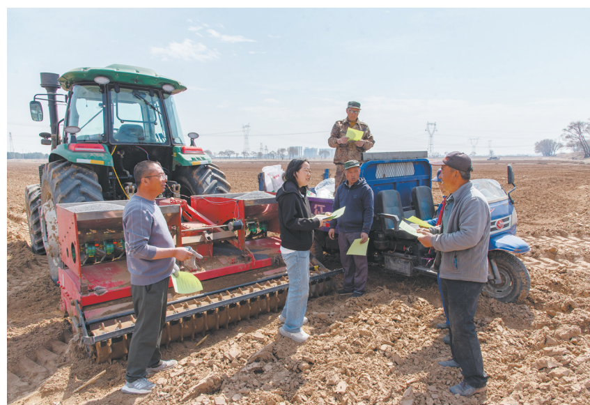
云冈区专业合作社组建农技服务队，深入田间地头开展现场教学。

春风送暖，沃野复苏，全市春耕生产序幕全面拉开。作为云冈区粮食种植的主导产业，玉米春耕备耕工作正蹄疾步稳、有序推进，全区以规模化农机作业为抓手，以标准化备耕举措为支撑，为全年玉米丰产增收筑牢坚实基础，奏响了春日里生机勃勃的农耕奋进曲。