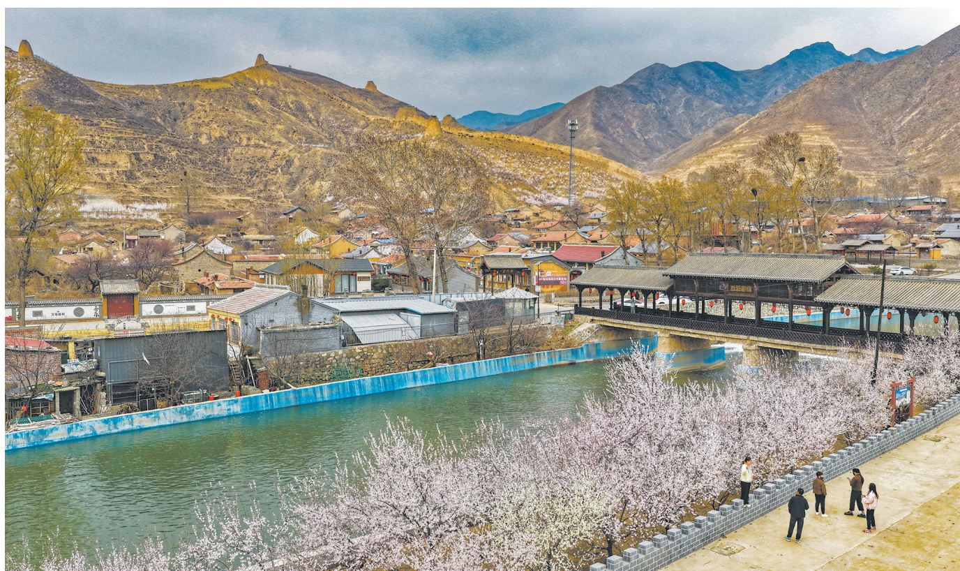
塞上春风拂面，处处洋溢着春意盎然的勃勃生机。4月9日，沿着长城一号旅游公路大同段前行，长城脚下春光旖旎，美景如画。

“十四五”期间，我市把增进民生福祉作为发展的根本目的，通过一系列务实举措，推动居民收入持续增长，收入结构不断优化，为实现共同富裕迈出了坚实步伐。