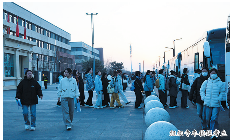
组织专车接送考生

本报讯(记者 解慧)近日,2026年普通高校专升本考试顺利开考。大同师范高等专科学校周密谋划、精心部署,统筹协调专人专车,全程护送1705名学子奔赴各考点,以细致入微的服务传递温暖,用实际行动践行“以生为本”的育人理念。