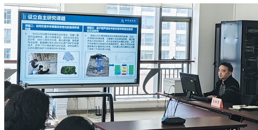
石窟寺保护与传承山西省重点实验室开展建设验收暨重组方案论证会

本报讯（记者 赵喜洋）4月3日，山西省科技厅组织专家对云冈研究院牵头的石窟寺保护与传承山西省重点实验室开展建设验收暨重组方案论证会。山西省科技厅、山西省