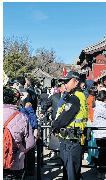
相关部门协同作战，构建起高效顺畅的假日运营保障体系

清明小长假的圆满收官，不仅是对云冈石窟景区综合管理能力的一次成功检验，更是其持续推动文旅融合、提升服务品质的生动缩影。云冈研究院相关负责人说，展望未来，云冈石窟仍将继续深耕历史文化内涵，创新文旅体验形式，拓展数字化、沉浸式、研学游等多元场景，努力让古老的文化遗产以更富活力、更具感染力的方式走进公众视