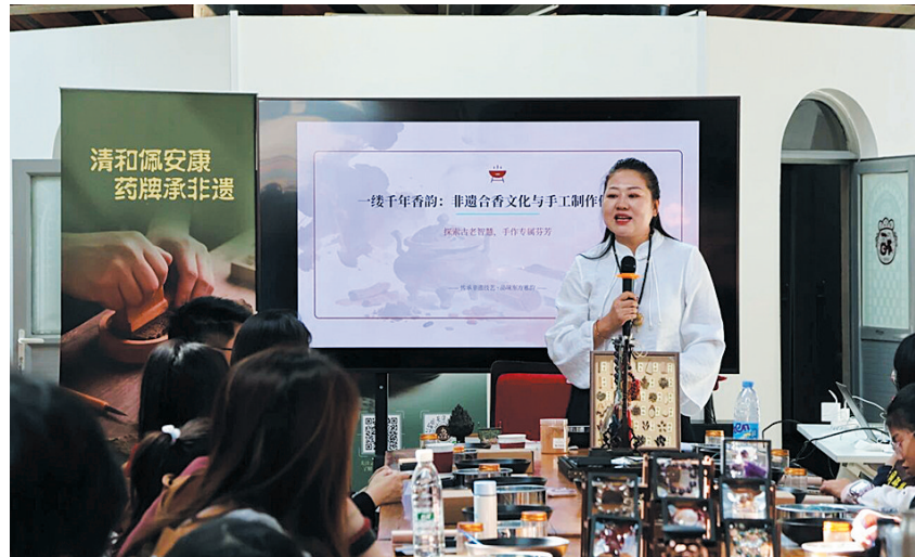
“云冈非遗·篆香承古韵”活动现场

本报讯（记者 赵小霞）清明假期，云冈石窟景区举办了“云冈非遗·篆香承古韵”和“云冈非遗·药牌佩安康”两场非遗体验活动，为游客的游览之旅增添了丰富的文化韵味。