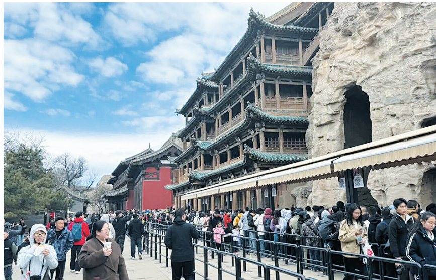
游人如织但秩序井然

春回大地，万物复苏。2026年清明小长假在融融春意中落下帷幕。云冈石窟景区以“春和景明，云冈常新”为主题，圆满完成了为期3天的假日接待服务工作。假期期间，景区内游人如织、秩序井然，累计接待游客90036人次。来自全国各地的游客慕名而来，在明媚春光中走进这座跨越千年的石刻艺术