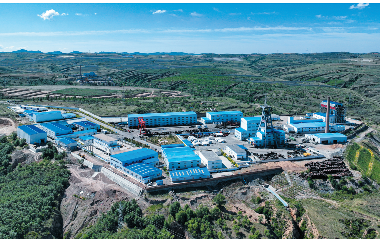
图为晋能控股煤业集团马脊梁矿。