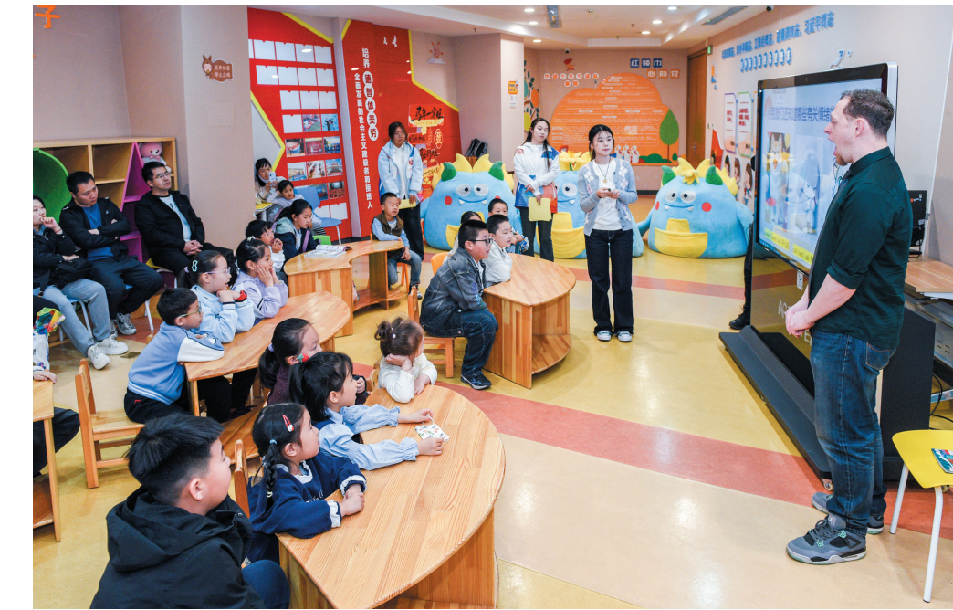
4月11日下午，大同大学外国语学院、国际交流中心联合市图书馆开展双语故事公益故事会。本次活动以经典神话《精卫填海》为主题，为少年儿童打造沉浸式双语趣味课堂。活动寓教于乐，通过互动讲解让孩子们感悟中华优秀传统文化魅力，感受英语学习的乐趣，助力少儿全面健康成长。图为外教老师为孩子们讲解故事中涉及的英文单词。

此次观摩活动以“现场看、现场学、现场交流”的形式，帮助农户全面了解新型播种覆膜机的性能与操作要点。该公司将持续加大先进农机装备推广力度，常态化开展田间观摩、技术培训、实操指导等活动，推动更多高效、适用本地农事生产的农业机械广泛应用，以机械化、标准化、精细化助力农业提质增效。