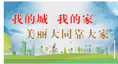
我的城 我的家 美丽大同靠大家

田欣悦说：“我觉得文创最大的魅力，是它让文化变得可以‘带走’。从卖文创到爱文创，我也重新认识了大同。”而她手中的每件文创产品，都像一扇小小的窗，让外地人看见大同，也让大同人的重新珍视自己的文化。