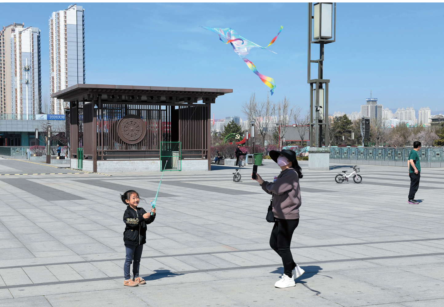
和煦春风拂古城大地，市民纷纷走出家门，尽享春日美好时光。连日来，在永泰门广场，休闲健身、文体活动日渐火热，处处洋溢着轻松愉悦的氛围。因为家长带着孩子放风筝。

曹鹏晨心里装着更大的蓝图。年前，企业已在市区开设5个“大同赋”线下体验馆，市场反响良好。新的一年，他计划开放酿造体验馆、联动云冈石窟、大同古城等文旅IP，让游客在品鉴佳酿的同时触摸北魏文明。“让游客看完大佛、逛完古城，再到我们这里品一品酒香，让北魏酒文化真正融入大同的文旅版图，服务好地方经济。”曹鹏晨信心满满。