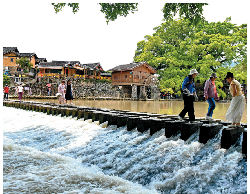
4月9日，游客在福建省漳州市南靖县梅林镇云水谣古镇参观游览。 作为独特的山区大型乡土民居建筑，福建土楼主要分布在龙岩永定、漳州南靖和华安等地，2008年被列入《世界遗产名录》。近年来，当地精心打造“福建土楼”文旅品牌，持续推进土楼保护、活化利用与文旅融合，实现生态、文化与旅游高质量发展。