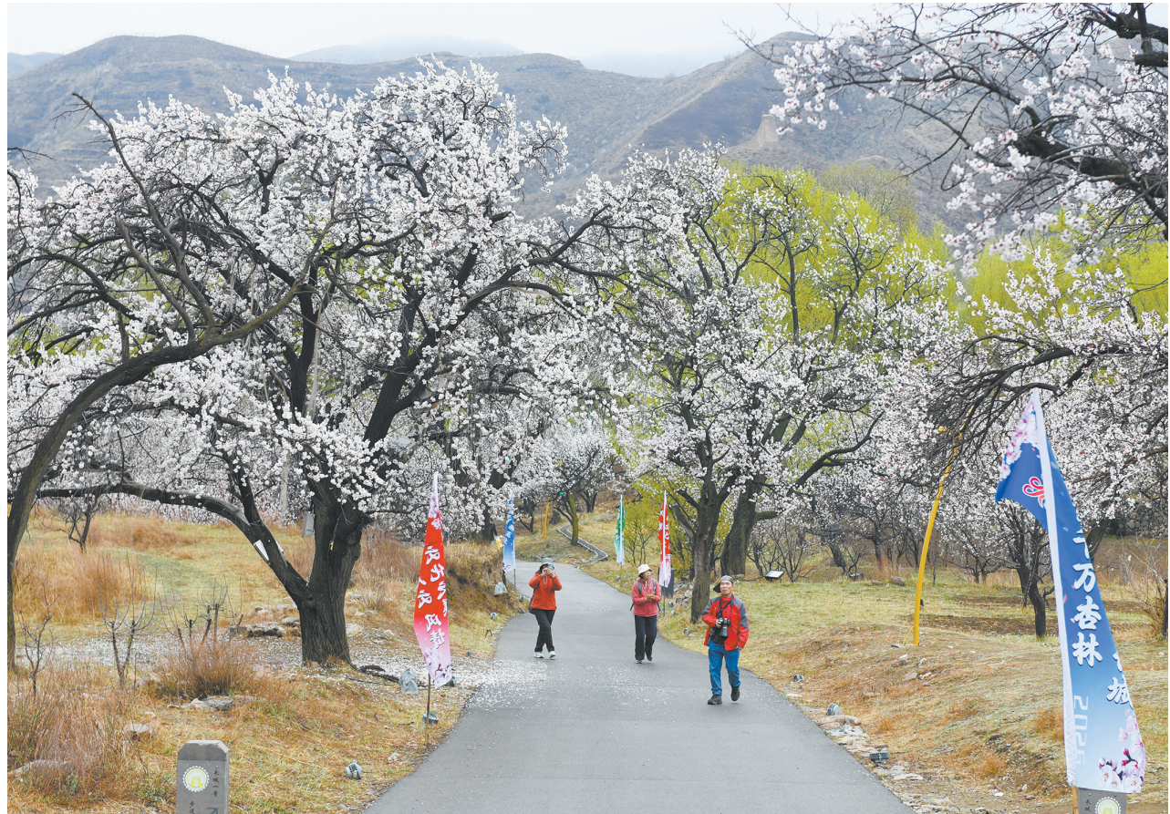
4月16日,雨后的阳高县守口堡空气清新湿润,漫山遍野的杏花经雨水润泽,更显莹白粉嫩、水润剔透。杏花与古城交相辉映,迎来一批批踏青的市民、游客赏花游玩,在朦胧雨雾中晕染成一幅浓淡相宜的水墨边塞图。

大同市原第一商业局党委副书记庞秀峰同志,于2026年4月14日逝世,享年91岁。庞秀峰同志,1935年4月出生,山西省阳高县人,1955年6月加入中国共产党,1955年9月参加工作。曾任大同市委机关党委宣传部副部长、大同市第一商业局纪检书记、大同市第一商业局党委副书记。1995年6月退休。按照本人生前意愿,丧事从简,特此讣告。