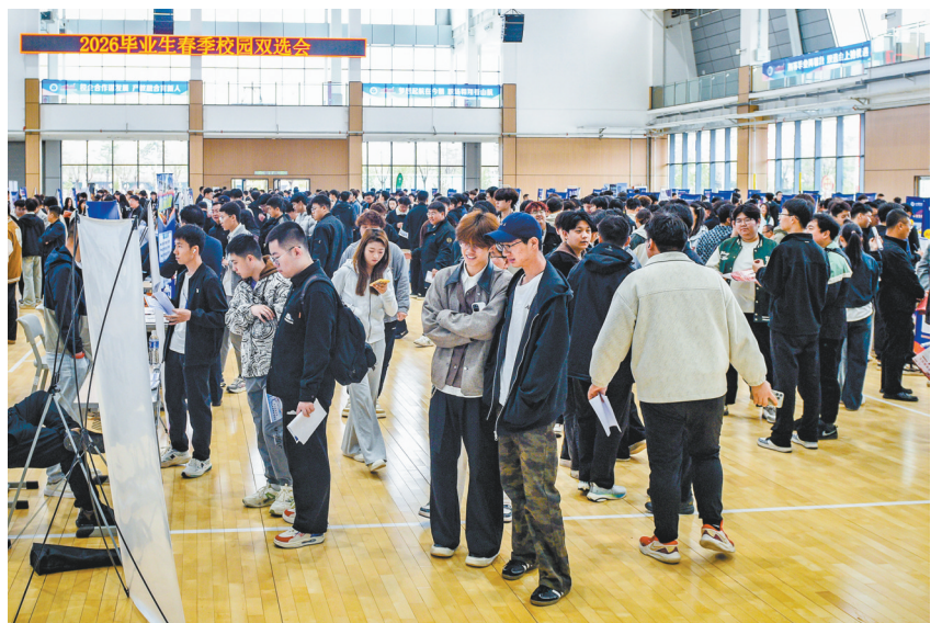
图为山西通用航空职业技术学院学生在双选会现场挑选心仪的工作岗位。

招聘会现场,许多学生一早便排起长队,认真研究企业信息,主动与招聘人员沟通。据统计,本次双选会上,400余名学子初步达成就业意向。