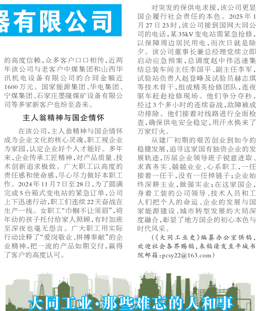
大同工业·那些难忘的人和事

该公司秉承“国企品质，终身质保”的服务理念，建立“24小时响应、48小时到场”的售后服务机制，为用户提供“保姆式”服务。对因各种原因导致的变压器故障，具备现场抢修条件的第一时间现场抢修，如现场条件受限则回厂维修，用户满意度保持在99%以上。通过面对面的优质服务不仅增加了业务量和收入，而且通过实地了解客户的痛点，及时分析、掌握各企业各种型号变压器的长处与短板，弥补自身产品的不足，为提供定制化的变压器解决方案奠定了坚实基础，进而开发出品质更优良的变压器产品。优质服务赢得了客户