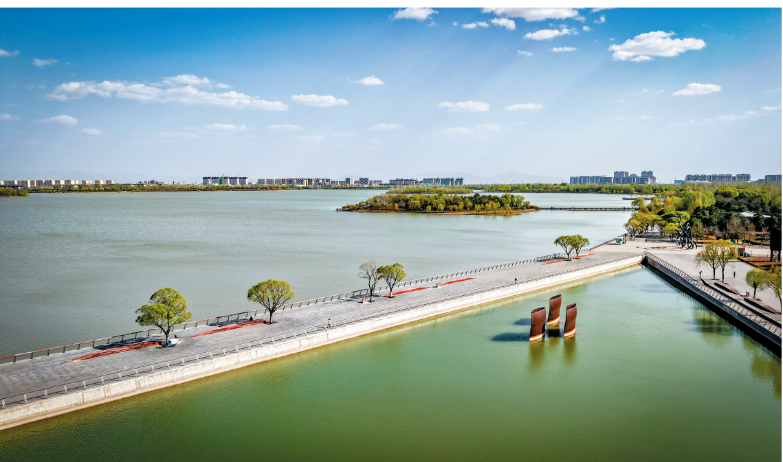
图为文瀾湖生态公园一角。

春风拂过，天朗气清。漫步在文瀾湖生态公园，抬头可见湛蓝的天空、洁白的云朵，举目四望是盛开的春花、潺潺的碧波。以“大同蓝”为底色的美景，已然融入市民日常，成为动人的幸福“陪伴”。