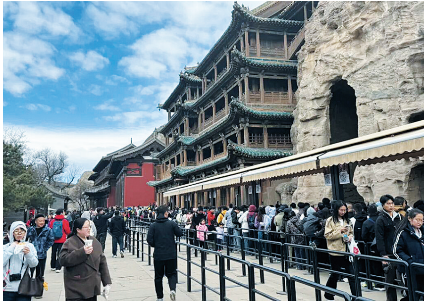
越来越多的游客青睐“石窟游”

近年来，大众对石窟的热情越来越高，那么石窟的魅力是什么？这个问题我也在思考。其实现在不仅仅有“石窟热”，也有“博物馆热”，有些地方甚至一