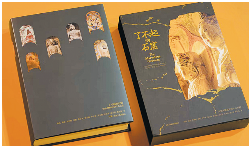
《了不起的石窟：全景式解读中国十大石窟》

当石壁翻开扉页，一场穿越千年的“纸上云游”就此启程；当扉页照进现实，云冈石窟传承千年的文化密码便在眼前缓缓解开。4月23日是世界读书日，记者走进云冈石窟，在缕缕书香与石壁洞窟之间，致敬一个王朝的伟大与神圣，也致敬当代云冈人为保护这一人类杰作所付出的心血与取得的成果。