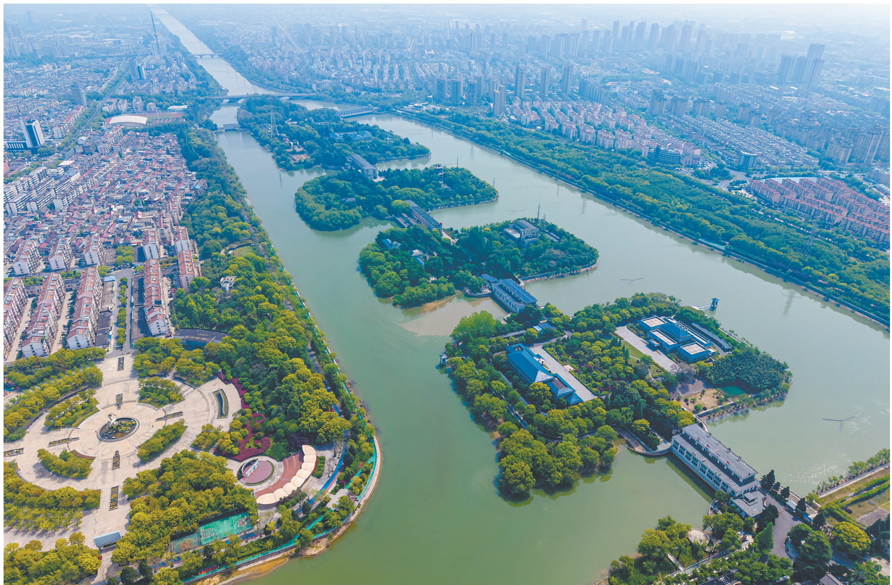
4月27日拍摄的位于江苏省扬州市江都区的南水北调东线源头江都水利枢纽（无人机照片）。