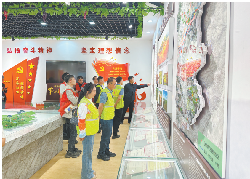
5月13日，市直机关工委联合市委政研室、大同证券公司开展支部主题党日暨志愿服务活动，组织党员干部赴左云县清风林党性教育中心开展党性教育，从“时代楷模”张连印将军的先进事迹中汲取力量，以实际行动护绿兴绿护绿，助力美丽大同建设。