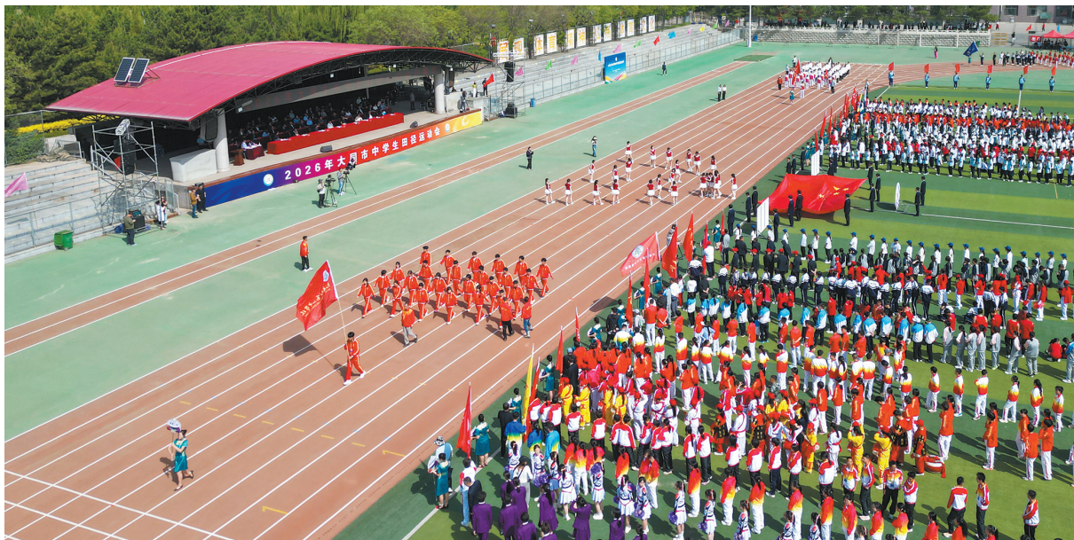
图为全市中学生田径运动会开幕式现场。

本报讯（记者 高燕）5月13日，由市教育局、市教育局主办的2026年全市中学生田径运动会在示范性综合实践基地体育场开幕。全市10所县区中学及27所市直中学的逾1200名运动员同台竞技，展现青春风采。