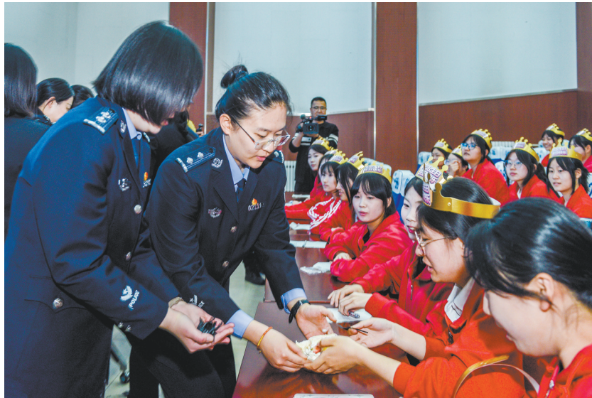
图为活动中，民警为学生送上法治礼物。