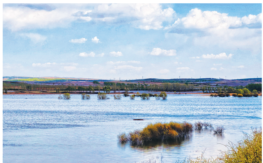
湖面碧波荡漾，美景如画。