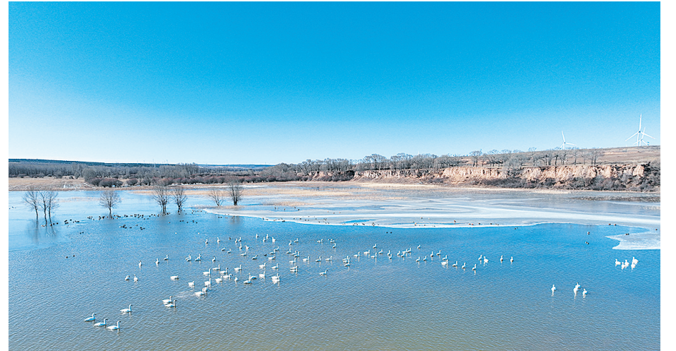
成群翱翔的候鸟构成了一幅灵动秀美的生态画卷。