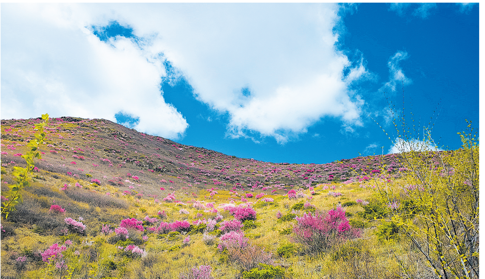
山桃花、山杏花层层叠叠，像打翻的调色盘。