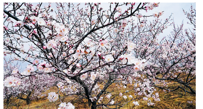
暖风漫过郊野，赴一场花的盛宴。