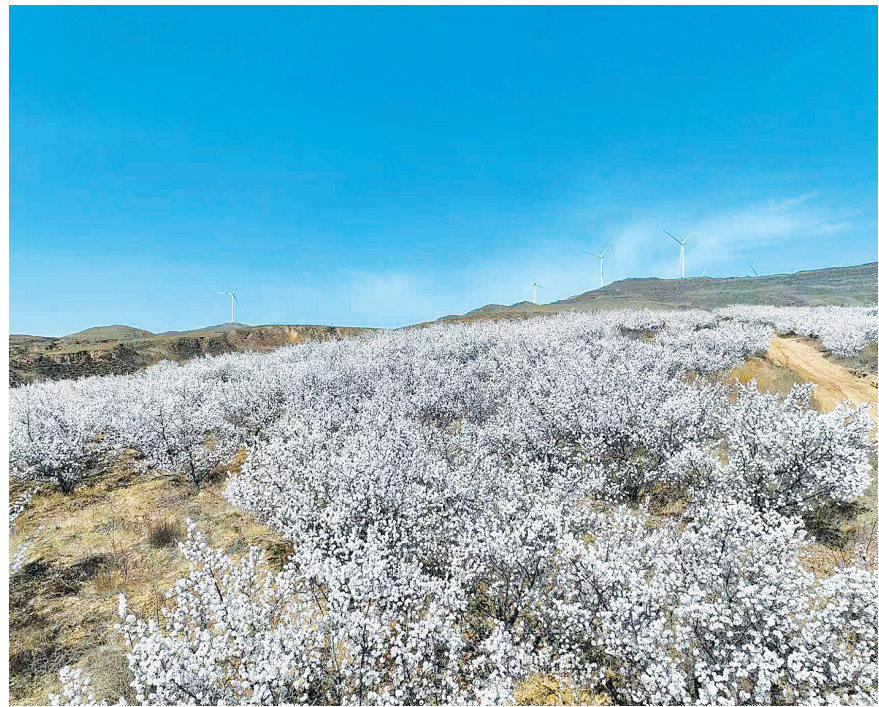
倚坡而立，粉白花朵缀满枝头。