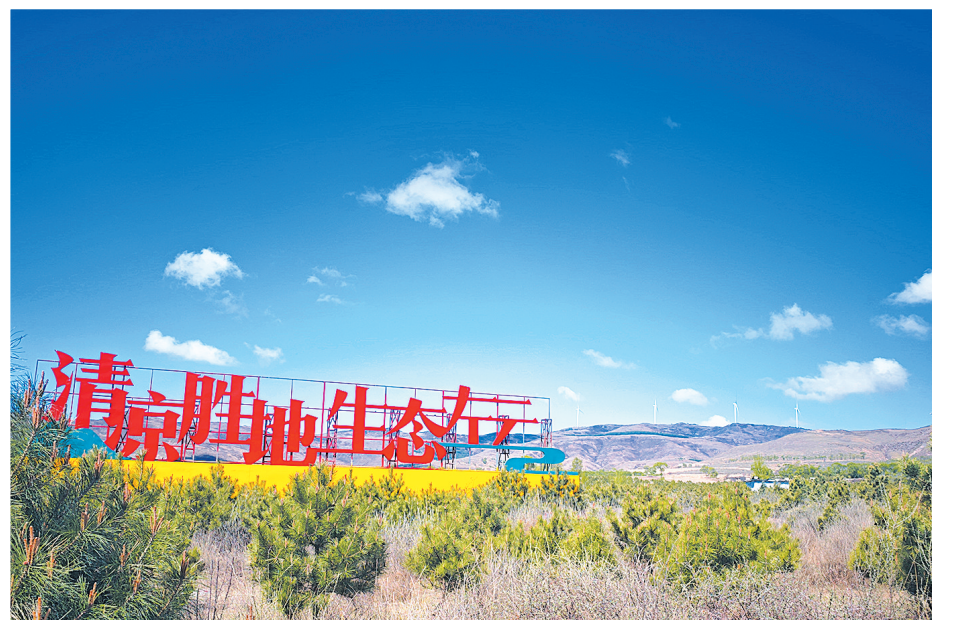
清凉胜地，生态左云。