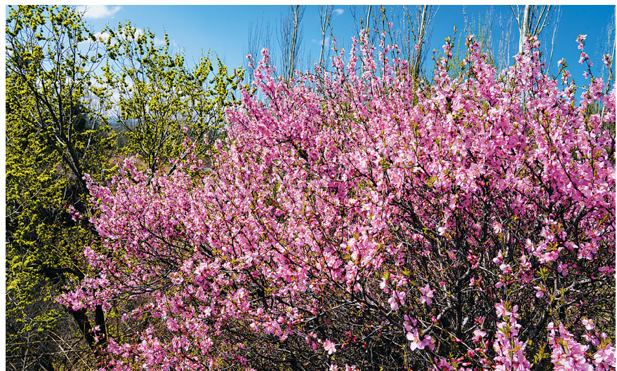
花瓣把大地装扮得艳丽多姿。