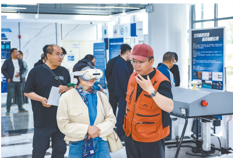
图为出席活动的嘉宾参观科技成果展示。

本报讯(记者 高燕)5月25日,由市科技局、市委宣传部、市科协主办,大同经开区科技创新服务中心