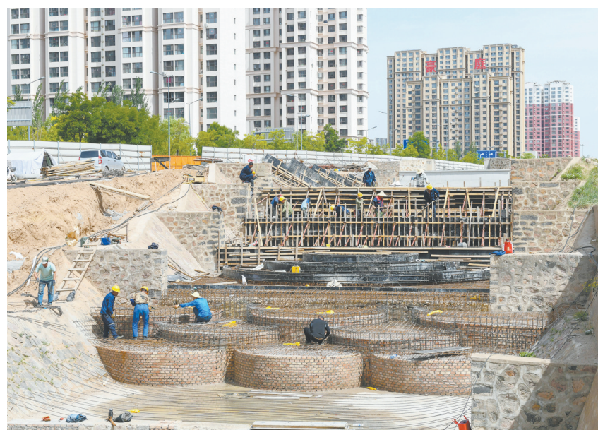
连日来，御河灌区西干渠（东坑分水闸至开源街段）水生态环境综合整治工程项目现场机械轰鸣，施工人员进行“全速模式”推进项目建设。作为全市水生态环境提升重点工程，目前，该项目施工进度已完成65%，全长8.413公里的生态水廊正沿渠岸徐徐铺展。

此次活动依托文旅资源拓宽普法渠道，实现法治建设与文旅产业双向融合、互促共进。左云县将常态化开展沉浸式、场景化普法活动，让法治精神浸润乡土、惠及群众，持续夯实平安建设工作根基，为该县各项事业发展筑牢法治屏障。