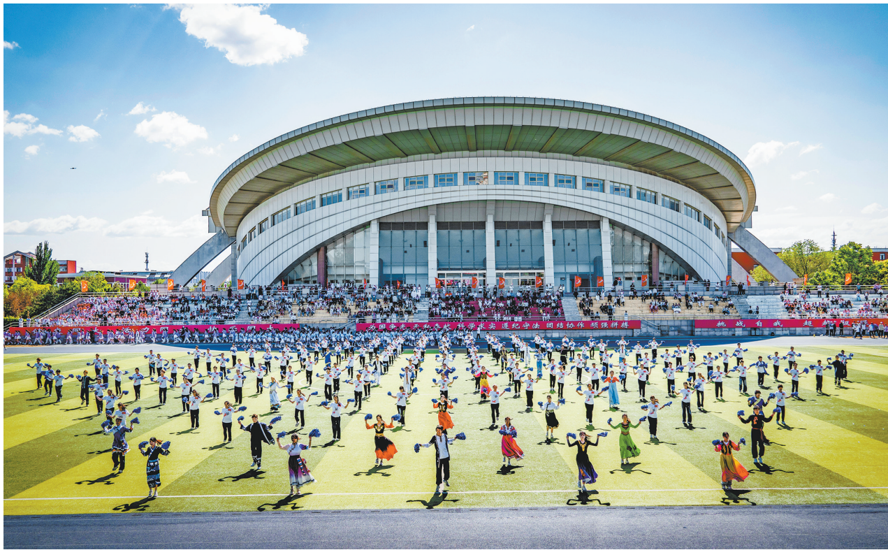
图为大同大学运动会开幕式舞蹈表演。