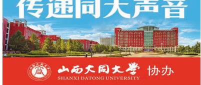
讲好同大故事 传递同大声音

学院将五行八卦、五禽戏等中医元素融入律动;护理学院把心肺复苏急救节奏编入快板,展现专业特色。最后,体育学院带来武术表演《龙腾狮跃·辉煌同大》,将现场气氛推向高潮。 一直以来,大同大学高度重视体育教育工作,坚定践行“健康第一”教育理念,围绕“四年一贯制”体育教学体系交出亮眼答卷。该校学生体质测试及格率稳步上扬,身体素质整体水平持续提升;两名学子凭借出色表现入选2026年亚运会集训队,高水平代表队斩获全国一等奖十余项、省级金牌50余枚;该校“岗前培训+三维实践+成果转化”体育支教模式已覆盖省内24所基层学校,累计受益超1.9万人次,体育人才辐射效应持续扩大。