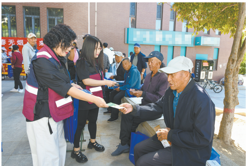
图为疾控工作人员向市民发放控烟宣传资料。

本报讯(记者 高燕)5月31日是第39个世界无烟日。5月29日,市疾控中心、平城区疾控中心开展宣传活动,把控烟健康知识送到群众“家门口”,进一步普及烟草危害知识,营造全民控烟、积极禁烟良好社会氛围。 宣传活动现场,疾控工作人员通过悬挂横幅、摆放展板、设置控烟咨询台、发放宣传资料等,向群众科普控烟知识,并用通俗易懂的语言讲解吸烟、二手烟带给身体的各类危害及科学戒烟方法。不少市民停下脚步,认真观看展板、主动索要宣传资料,并表示,这样的宣传活动“接地气、有干货”,增强了大家主动拒绝烟草、维护健康的意识。 我市疾控部门将常态化普及健康知识、传播无烟理念,引导群众摒弃吸烟不良习惯,特别是引导青少年养成“对第一支烟说不”的好习惯。