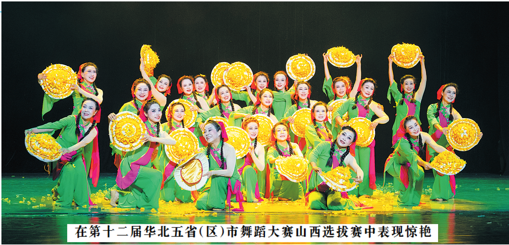
在第十二届华北五省(区)市舞蹈大赛山西选拔赛中表现惊艳