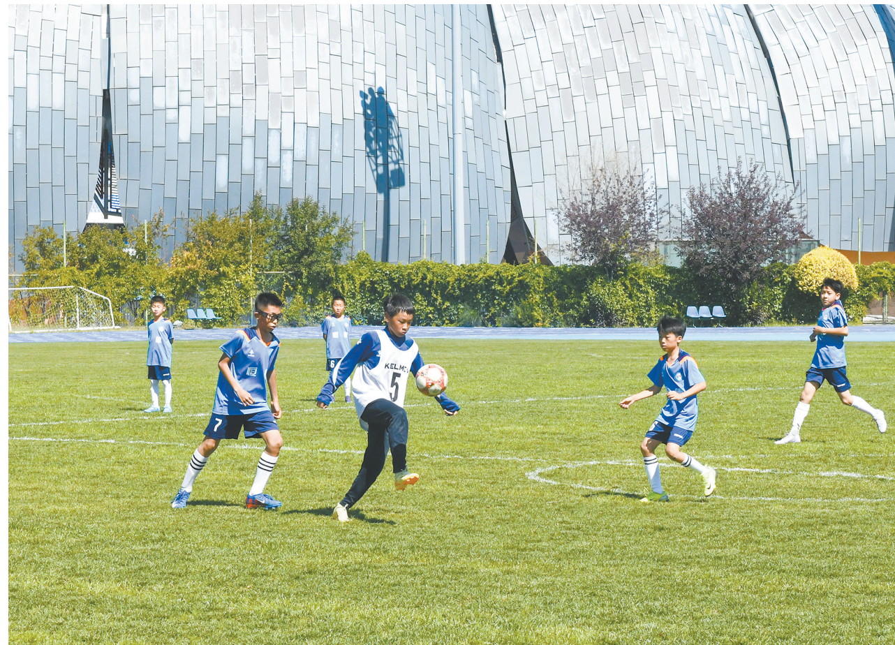
6月11日,市体育运动学校开展体教融合校园开放日活动。平城区恒德学校学生走进该校校园,观摩专业体育训练,近距离感受竞技体育魅力。

活动中,两校学生举行足球友谊赛,在切磋交流中增进友谊、提升球技,以体育为纽带深化体教融合,搭建校际交流良好平台。