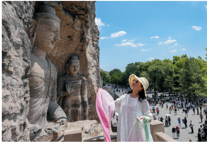
6月11日,游客在云冈石窟参观。