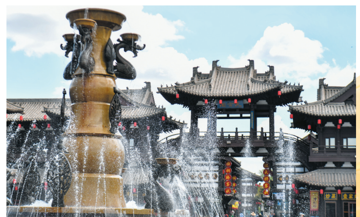
这是6月10日拍摄的大同古城风景。