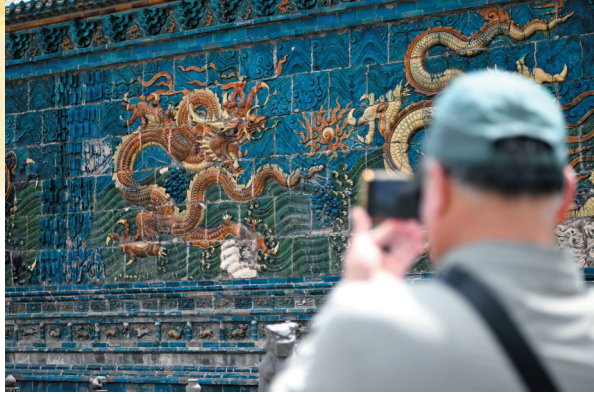
6月10日,游客在大同古城内的九龙壁前拍照。