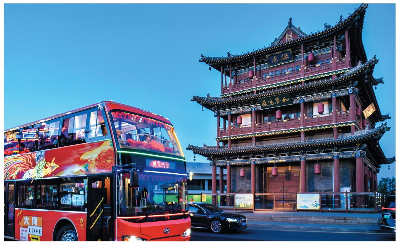
这是6月10日拍摄的大同古城风景。