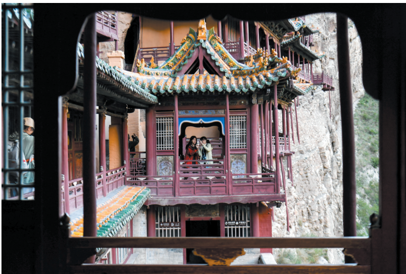
6月9日,游客在大同市浑源县悬空寺拍照留念。