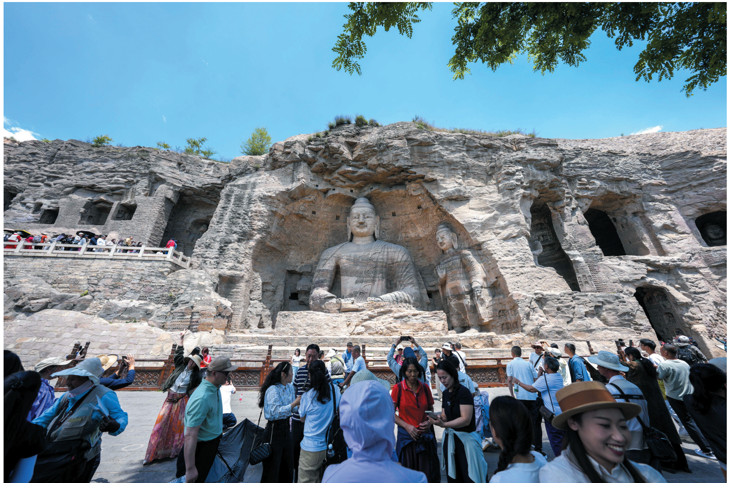
6月11日,游客在云冈石窟参观。