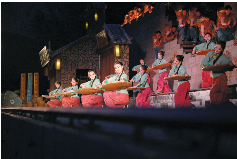
6月9日,演员在《何以悬空寺》实景演出出现场表演。