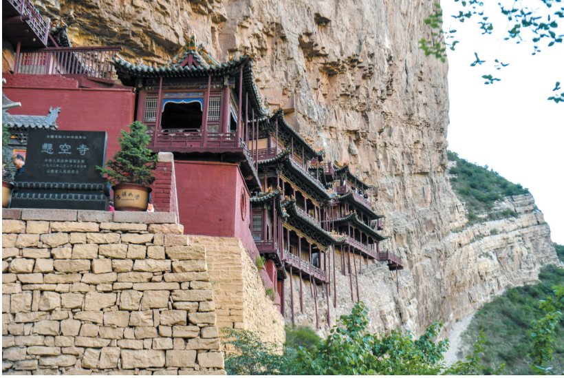
这是6月9日在大同市浑源县拍摄的悬空寺。