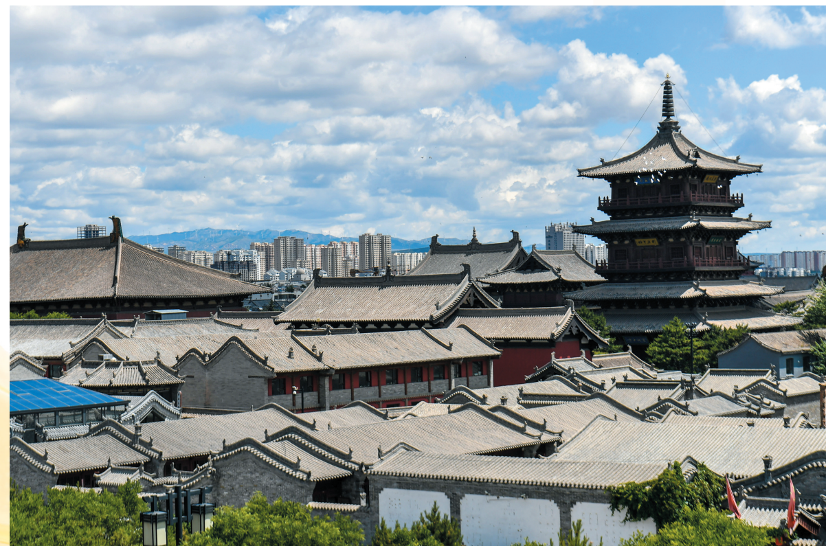
这是6月10日拍摄的大同古城风景。

作为国家首批历史文化名城,山西大同历史积淀深厚,拥有云冈石窟、悬空寺、古城墙等丰富的文化遗产资源。近年来,大同持续推进文旅融合发展,通过业态创新、科技赋能等措施,积极探索文化遗产活化利用的新路径、新场景,让古老文化遗产焕发新的活力。