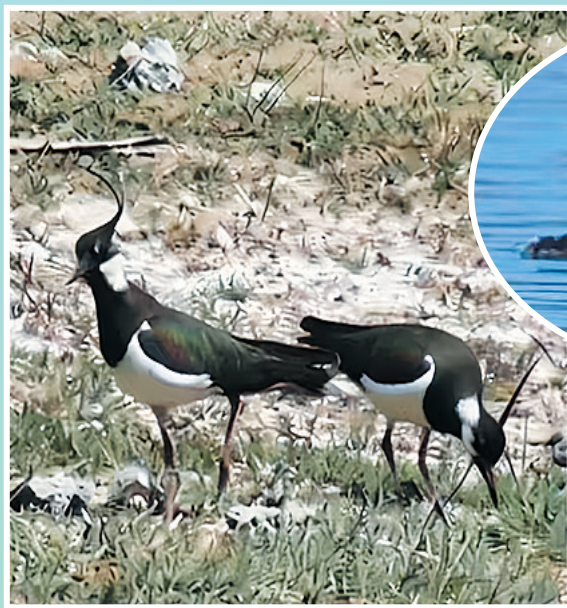
凤头麦鸡,国家二级保护动物。