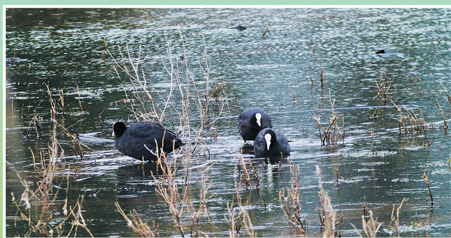
白骨顶,国家二级保护动物。