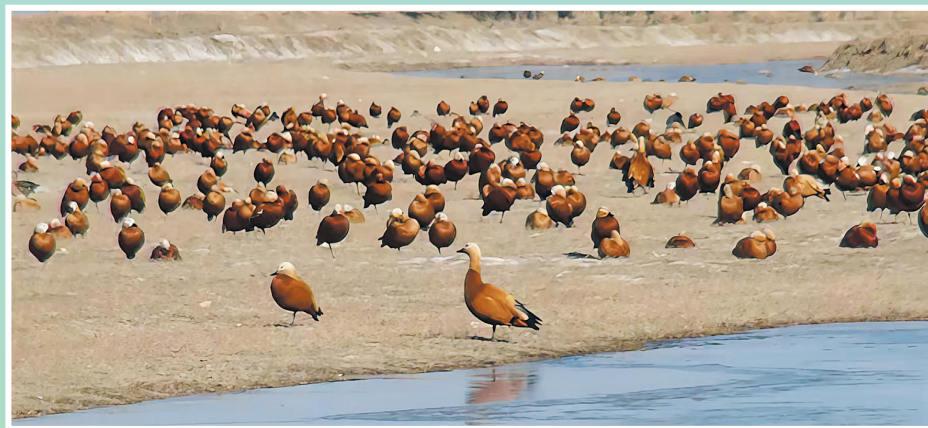
赤麻鸭,国家二级保护动物。