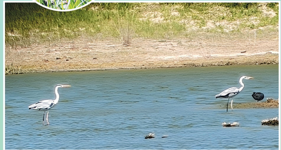
苍鹭,列入《世界自然保护联盟濒危物种红色名录》(IUCN)2019年 ver 3.1——无危(LC)。