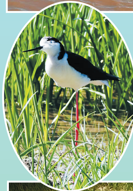
黑翅长脚鹬,国家“三有”保护动物。