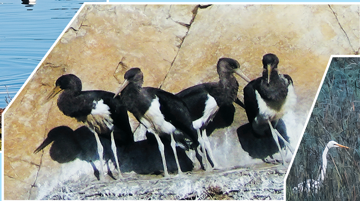
黑鹇,号称鸟中的大熊猫。国家一级保护动物。