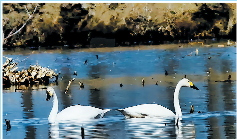
白天鹅,国家二级保护动物。