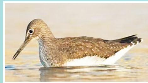
白腰草鹬,国家“三有”保护动物。