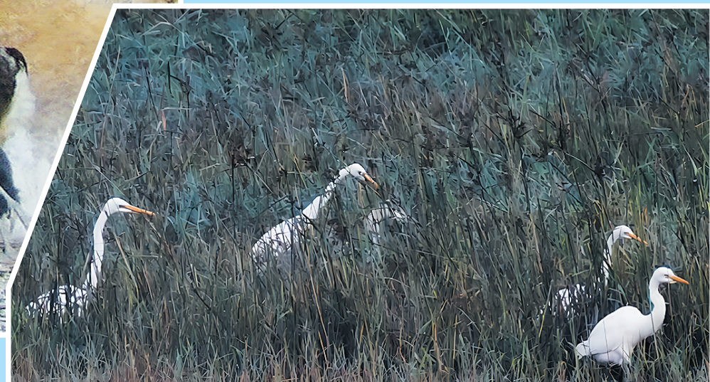
黄嘴白鹭,国家一级保护动物。