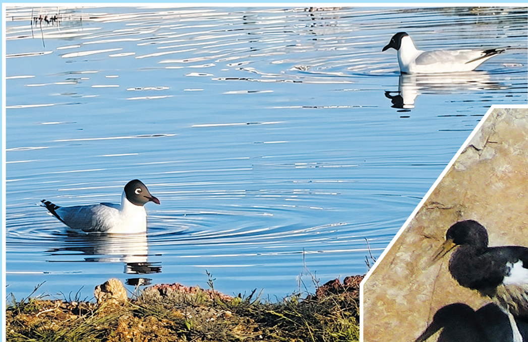
遗鸥,国家一级保护动物。