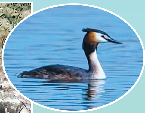
凤头鸊鷉,国家二级保护动物。