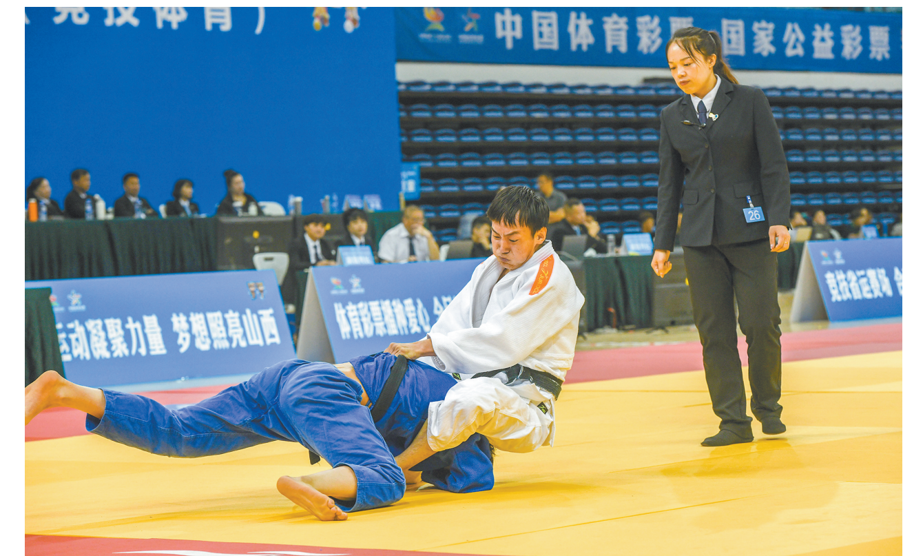
6月25日，第十七届省运会(竞技体育)柔道比赛在市体育中心体育馆开赛。本次赛事汇聚太原、大同、运城等全省10支代表队，312名运动员比拼技艺、展现风采。体育馆内气氛热烈，参赛运动员精神抖擞、斗志昂扬，攻防转换节奏紧凑，力量与技巧、速度与策略交织碰撞。

定向分配到初中学校的招生计划，录取时严格按照各有关学校的定向计划和考生志愿，定向招生学校在各自统招分数线下50分之内，且符合相关招生条件的考生中，从高分到低分择优录取。