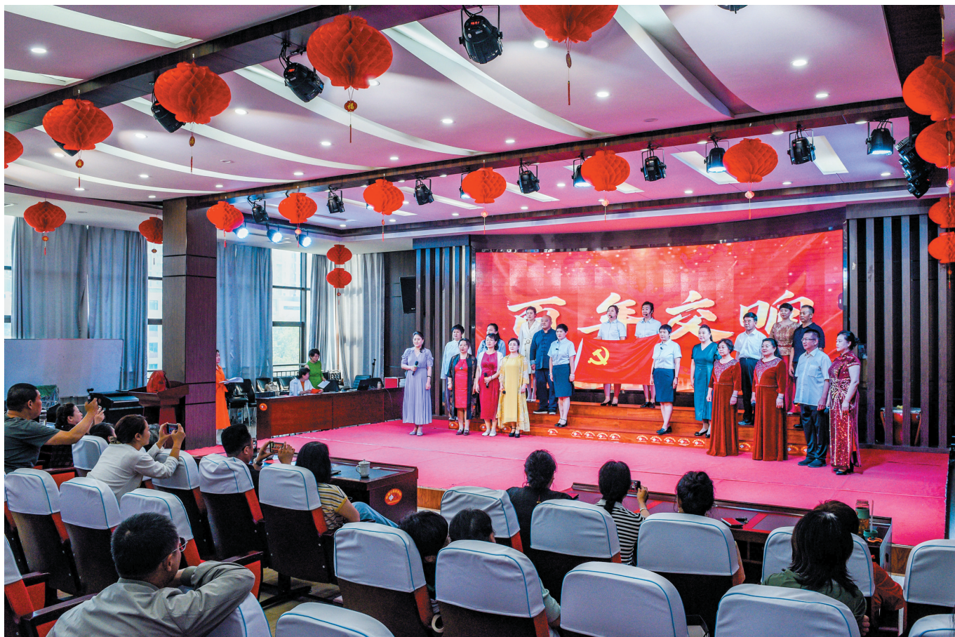
为庆祝中国共产党成立105周年，传承红色基因，6月26日下午，平城区文瀾湖街道华北里社区在党群服务中心开展“铭记历史 赓续华章”红色经典朗诵会。活动通过诵读红色篇章厚植居民爱党爱国情怀，丰富社区文化生活，以有声力量礼赞党的奋斗征程。图为朗诵会现场。