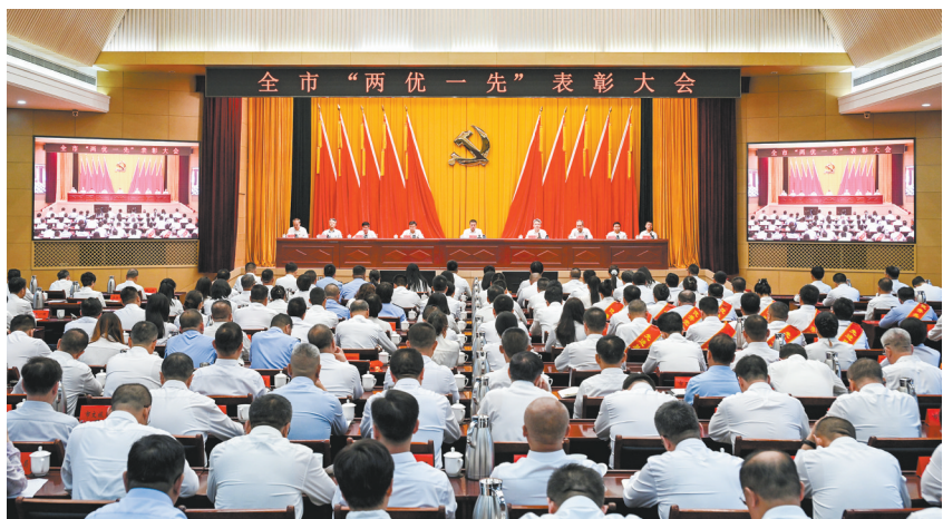
7月1日，全市“两优一先”表彰大会召开。

本报讯（记者 李明璇）在中国共产党成立105周年之际，7月1日，全市“两优一先”表彰大会召开，表彰全市优秀共产党员、优秀党务工作者和先进基层党组织，激励和动员全市各级党组织和广大党员、干部牢固树立和践行正确