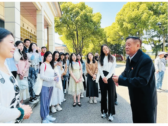
苏州市蒋巷村教学现场，选调生乡村振兴专题培训。