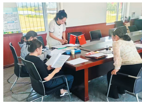
周士庄镇党建办干部下沉村级督导党建台账规范化整理工作。

从严监管，涵养清风正气。 坚守从严治吏主基调，健全监督机制、抓实全程监管、强化日常管控，以“严的标准、严的措施、严的纪律”管好用好干部，把干部“入口关”，落实“凡提四必”、廉政意见双签字制度，强化政绩观考察，严防干部“带病提拔”。严守民主推荐、考察研判、集体研究、任前公示等关键环节，实行全程纪实。坚持抓早抓小、防微杜渐，推动干部监督常态化、精细化。常态化开展违规经商办企业、违规兼职、“近亲繁殖”等问题专项清查，实行全覆盖排查、台账化管理、销号式整改，确保问题清零见底。规范因私出国（境）管理，健全台账、集中保管证件、严格审批报备，2021年以来完成新任提任副科级领导干部出国（境）报备136人，收回证件49本，实现应备尽备、应收尽收。强化经济责任审计，2021年以来下达审计通知书151份，聚焦资金使用、项目建设、履职尽责等重点，以刚性监督约束干部依规履职。