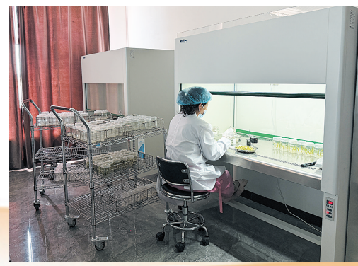
博士创新站科研人员正在进行黄花优异株系扩繁实验。

坚持分类推进，提升全域党建水平。 在社区，加强社区工作者队伍建设，招录82名35周岁及以下的社区工作者，落实“三岗十八级”工资待遇，对表现优秀的28名网格员选拔进入社区“两委”班子。实施“网格党建强化提升”行动，划细62个网格，构筑起“社区有网、网中有格、格中定人、人负其责”的管理格局。推动社区物业党建联建，形成工作联动机制。持续引深“五有双三三”机制，打造6个小区党群服务站示范点，引导57家单位1077名在职党员到小区报到，开展志愿服务活动6252人次。在机关深入实施“13111”工程，持续开展“五型模范机关”创建活动。在中小学校开展“党建引领、立德树人”活动，22个有独立法人、独立支部的中小学校全覆盖实行了党组织领导的校长负责制。在公立医院，开展了以比服务争创优秀党支部、比质量争做优秀党员、比奉献争做最美医护的“三比三争”活动，2所公立医院均实行了院党组织领导下的院长负责制。在国有企业，开展了国企党建工作规范化提升专项行动，党建融入和引领生产作用进一步发挥。在“三新”领域，开展了新兴领域党建“两个覆盖”攻坚行动，重点企业党的组织体系和体系更加健全，重点行业党组织覆盖面显著提升。