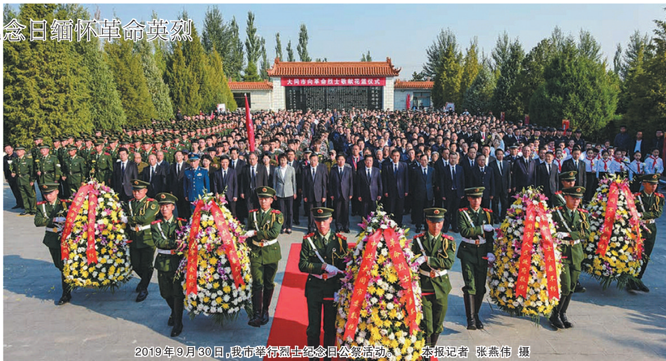
2019年9月30日，我市举行烈士纪念日公祭活动。