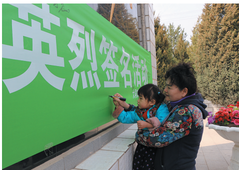
“传承·2019清明祭奠英烈签名”活动中，部队官兵和广大市民纷纷签名。