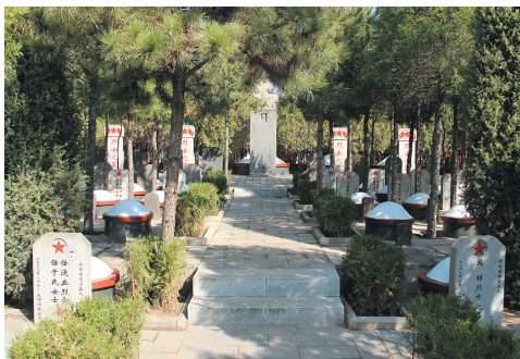
庄严、肃穆的烈士陵园