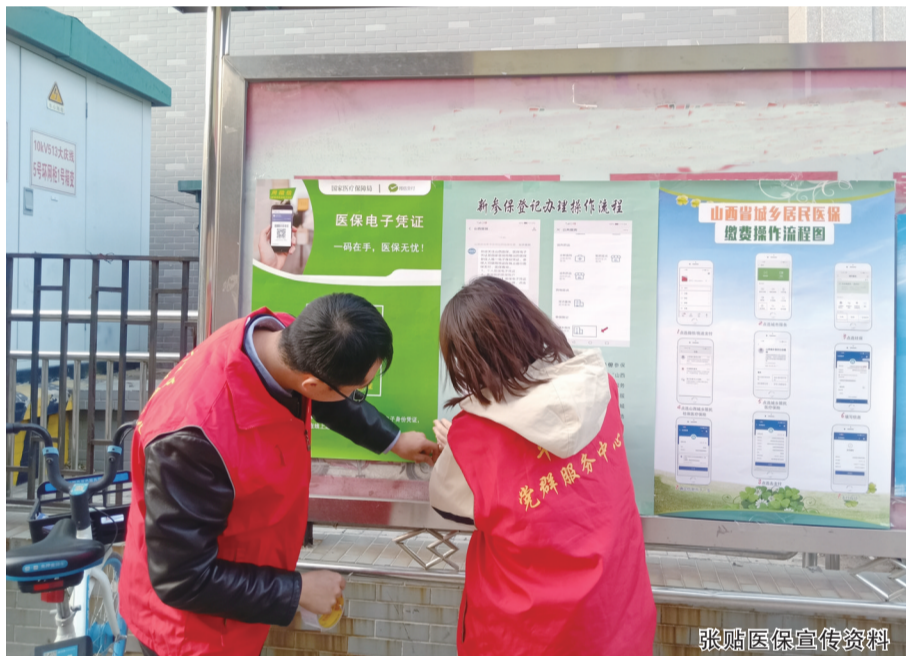
张贴医保宣传资料

工作人员向辖区居民发放医保信息登记、居民医疗费用报销、职工医疗费用报销、定点零售药店申报等一次性告知书,同时宣传居民医疗保险新政策和缴费方式,让居民及时了解医保的覆盖范围、参保时间、缴费标准等内容,有效提高了辖区居民参保的知晓率和积极性,保障居民医疗保险工作顺利开展。