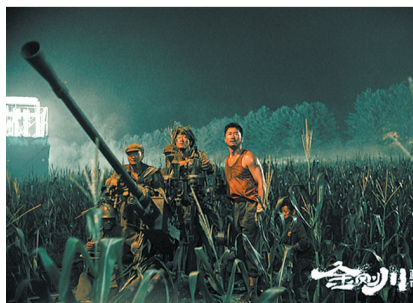
▲ 战斗场面真实激烈