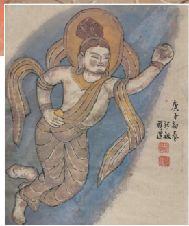
▲云冈石窟第七窟平棋藻井上的飞天 ▲第十窟飞天 ►第六窟飞天