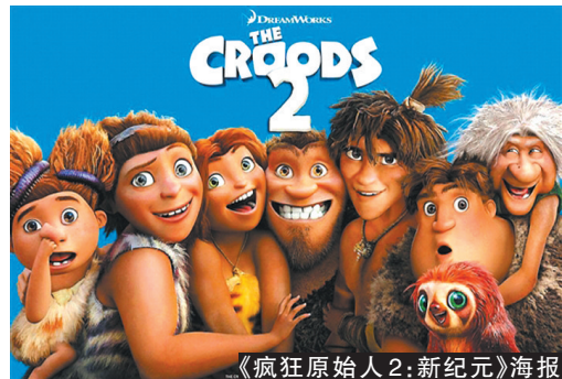
《疯狂原始人2:新纪元》海报