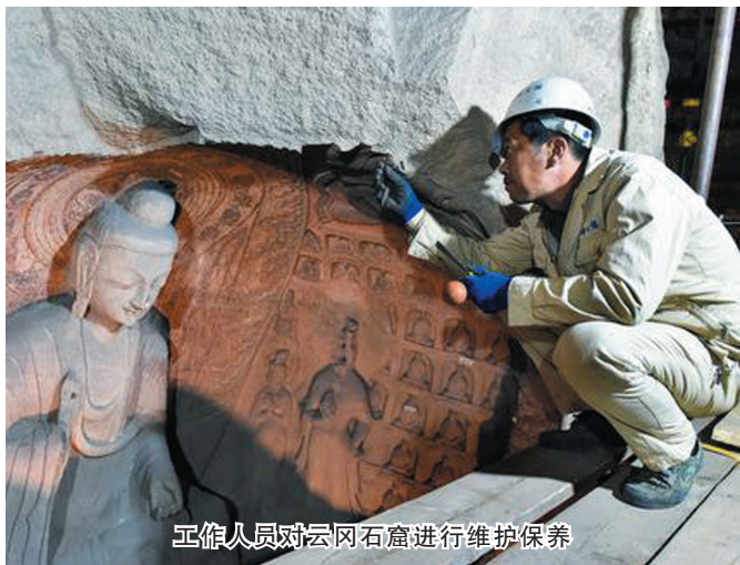
工作人员对云冈石窟进行维护保养

云冈石窟数字化工作于2003年起步，目前已经完成整体石窟约三分之一的数据采集，并计划在未来5年内完成全部洞窟的数字化信息采集，建立一个以时间轴为主线的三维石窟信息数据库。