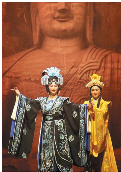
▲ 演出剧照 ▲ 《文明太后》海报