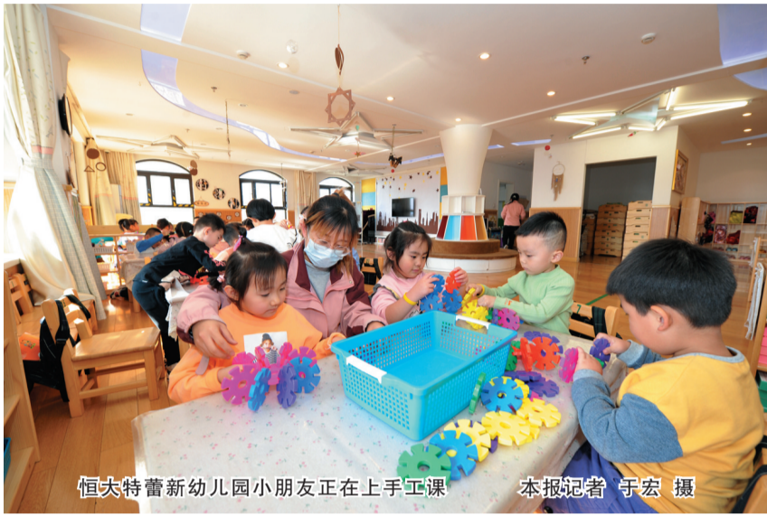
恒大特蕾新幼儿园小朋友正在上手工课