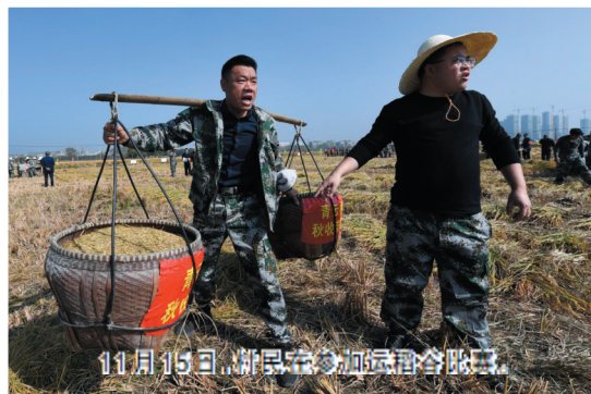
11月15日，浙江省杭州市富阳区富春街道春华村青云畈的千亩水稻田中举行秋收劳动竞赛。

甘肃省市场监管局食品流通监督管理处负责人张安俊介绍，对于直接面向消费者销售进口冷藏冷冻食品的经营商，必须索取供货商出具的“电子一票通”，并将其展示在销售场所，消费者在购买进口冷藏冷冻肉类、水产品时，可用微信扫码“电子一票通”上的二维码，或登录追溯平台查询产品信息。