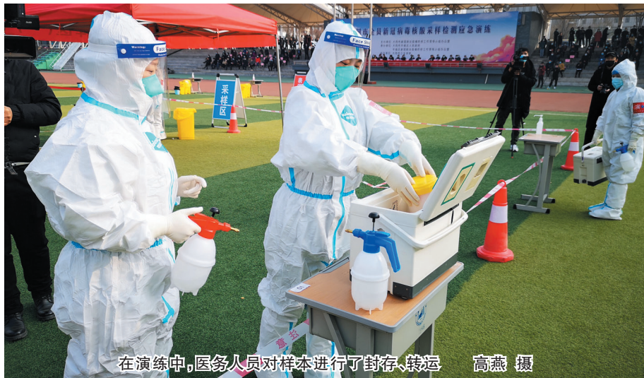
在演练中，医务人员对样本进行了封存、转运

为及时、科学、规范有序处置可能出现的新冠肺炎聚集性疫情，全面落实疫情防控措施，确保我市在发生本土聚集性疫情时，能在最短时间内完成区域全员核酸检测工作，切实维护人民群众生命安全和身体健康，16日，由大同市新冠肺炎疫情防控工作领导小组办公室组织的全员新冠病毒