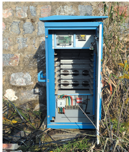
舜耕山风景区旁的一个充电桩，柜体中并没有充电模块。

部分城市“僵尸”充电桩的存在，不利于新能源汽车产业健康发展，不仅导致充电难，也让一些期待进入新能源汽车充电领域的市场主体望而却步。