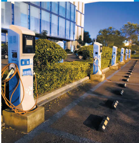
淮南政务服务大厅停车场充电站。