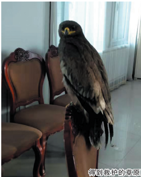
得到救护的草原雕宝宝

草原雕为大型猛禽，属国家二级保护动物，主要栖息于开阔平原、草地、荒漠和低山丘陵地带，以黄鼠、跳鼠、沙土鼠等小型脊椎动物为食。草原雕近年来数量稀少，2012年已被世界自然保护联盟列入濒危物种红色名录。