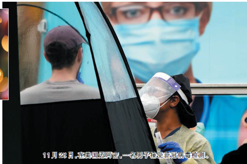
11月28日,在美国迈阿密,一名男子接受新冠病毒检测。

里克·托波尔27日在社交媒体推特上表示:“几周前我们还在为单日新增病例可能突破10万例担心,如今全美新冠住院病例都快达到10万例了。”