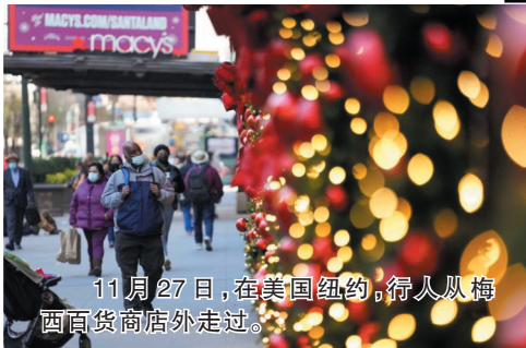
11月27日,在美国纽约,行人从梅西百货商店外走过。

美国疾病控制和预防中心28日公布的最新数据显示,全美27日报告新增新冠确诊病例超过17.6万例。这是美国单日新增确诊病例数连续第20天超过10万例。