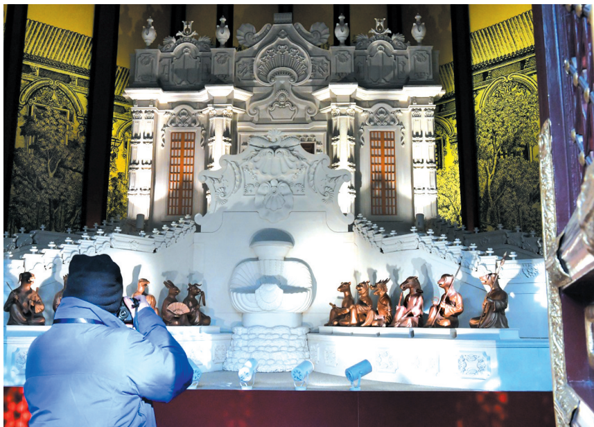
12月1日，在北京圆明园举行的《百年梦圆——圆明园马首铜像回归展》上，一名参观者拍摄圆明园长春园西洋楼建筑群海晏堂复原模型。

1日，《百年梦圆——圆明园马首铜像回归展》亮相正觉寺。展览以马首回归为主线，分为圆明重光、万园之园、马首回归三个单元，展出文物、照片等共约100组件，将作为正觉寺基本陈列持续展出。